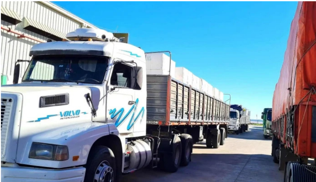
Ontur nueva palmira