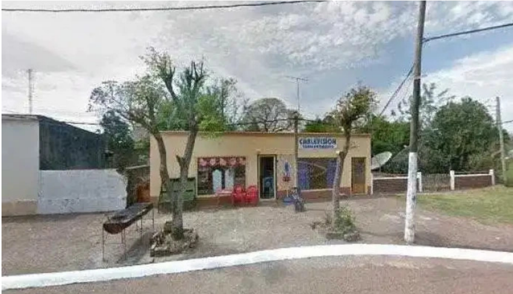
Cable vision tomas gomensoro puntajedeg