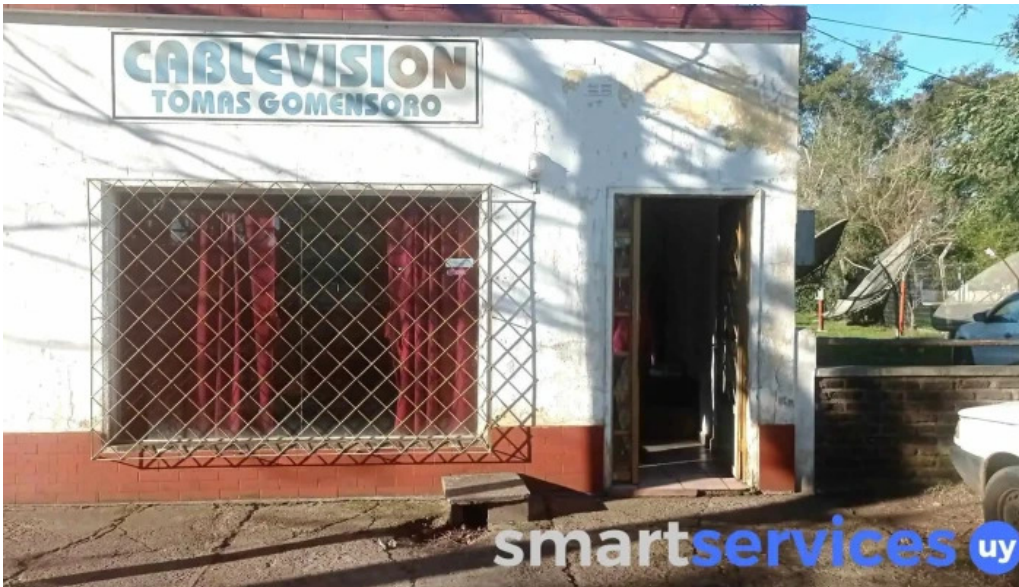
Cable vision tomas gomensoro puntaje