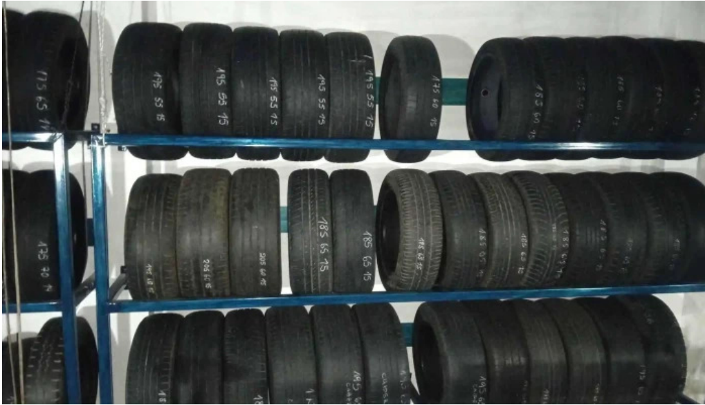
Electromecanica y gomeria carlos vecino taller mecanico