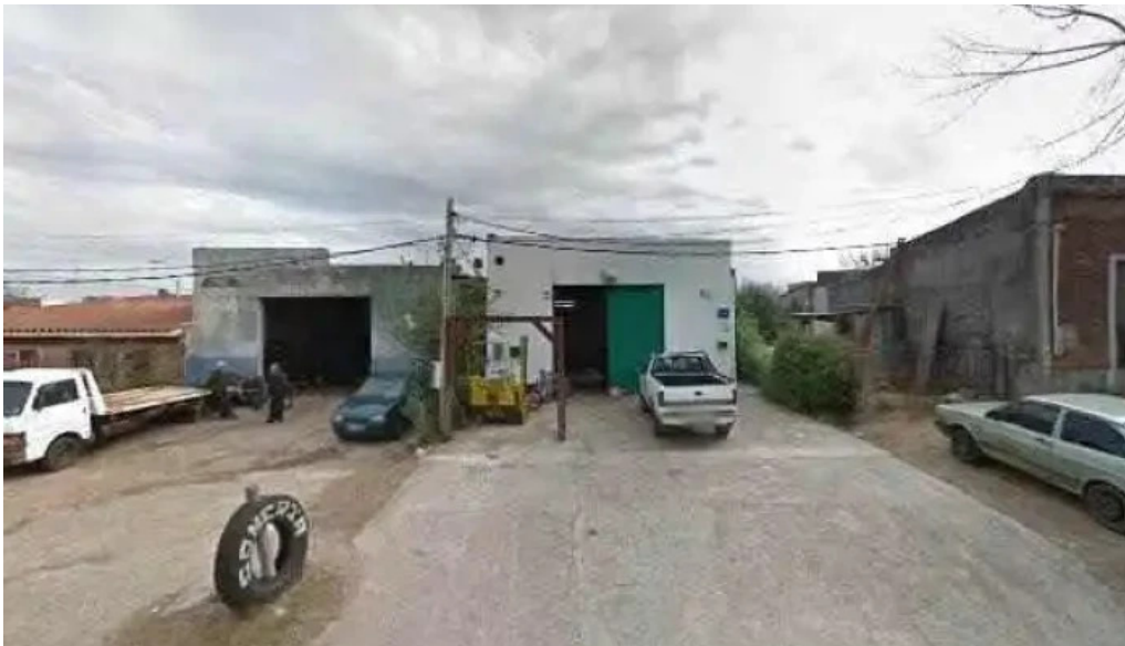
Electromecanica y gomeria carlos vecino videos