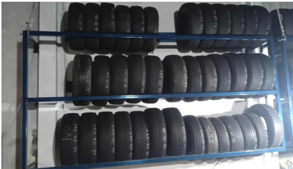
Electromecánica y gomería carlos vecino del propietario