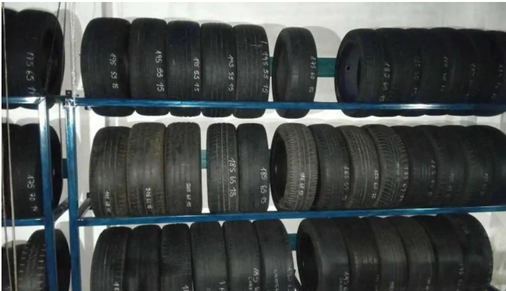
Electromecanica y gomeria carlos vecino pando