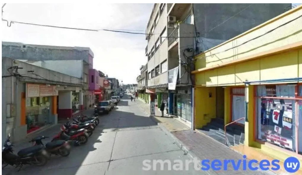
Radio club minas minas