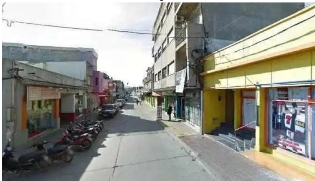
Radio club minas videos