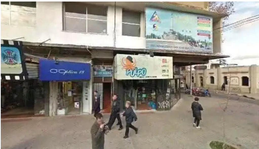
Optica 18 fotosdeg