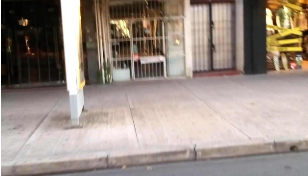
Optica 18 fotos