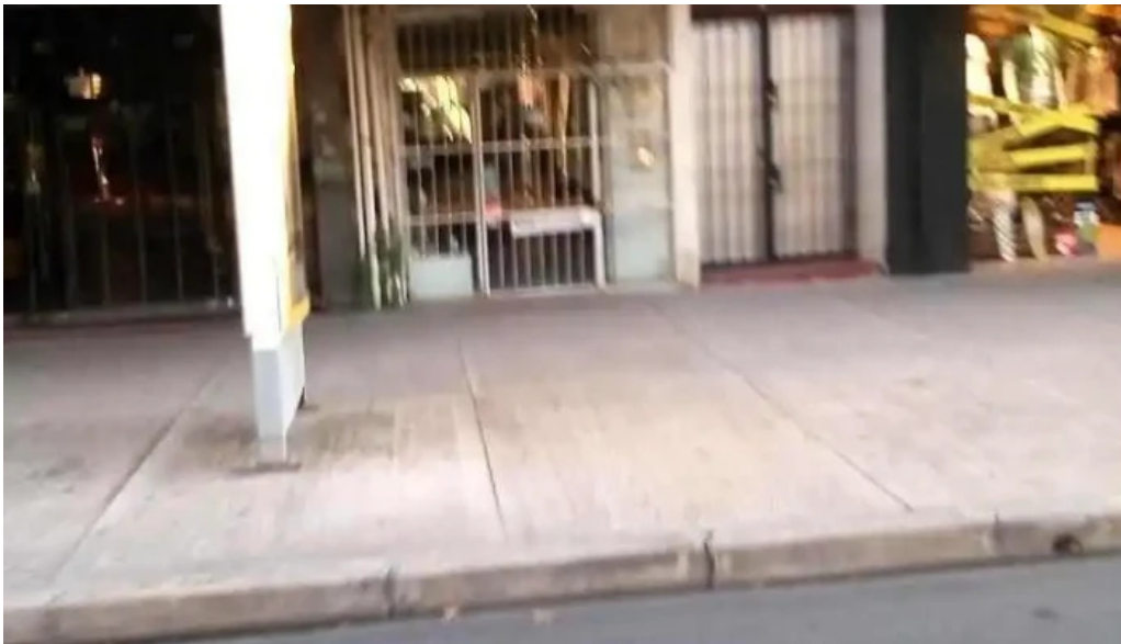
Optica 18 las piedras