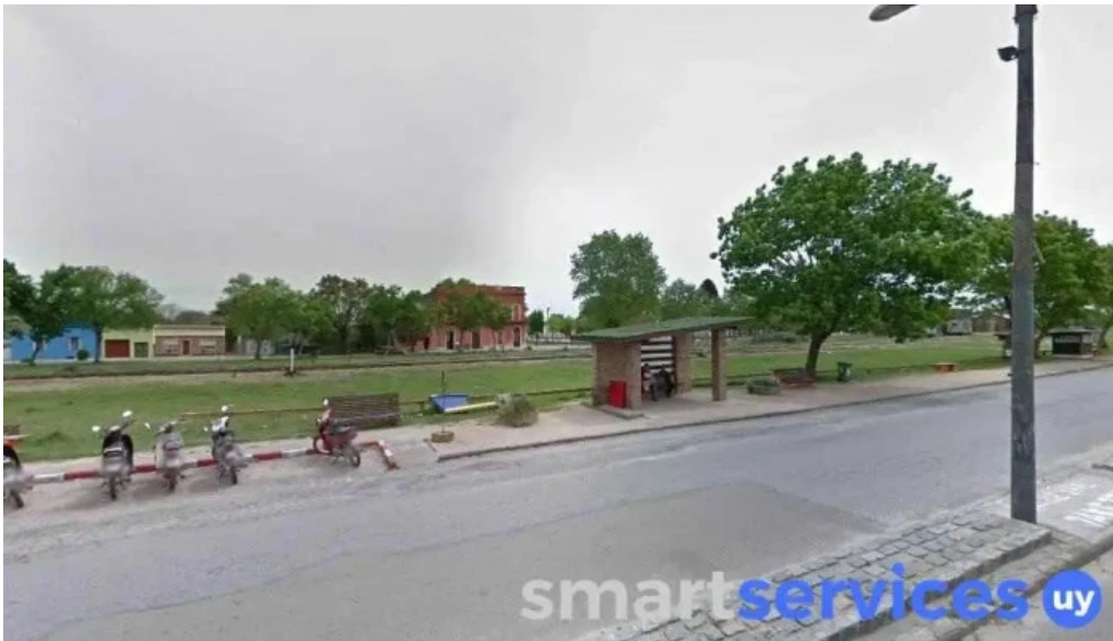
Redpago sarandi grande sarandi grande