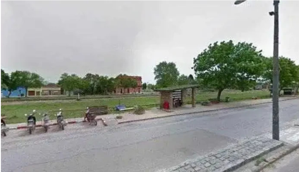
Redpago sarandi grande catalogo