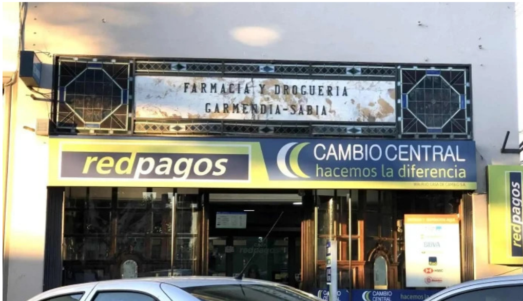
Redpagos y cambio central 25 de mayo exterior