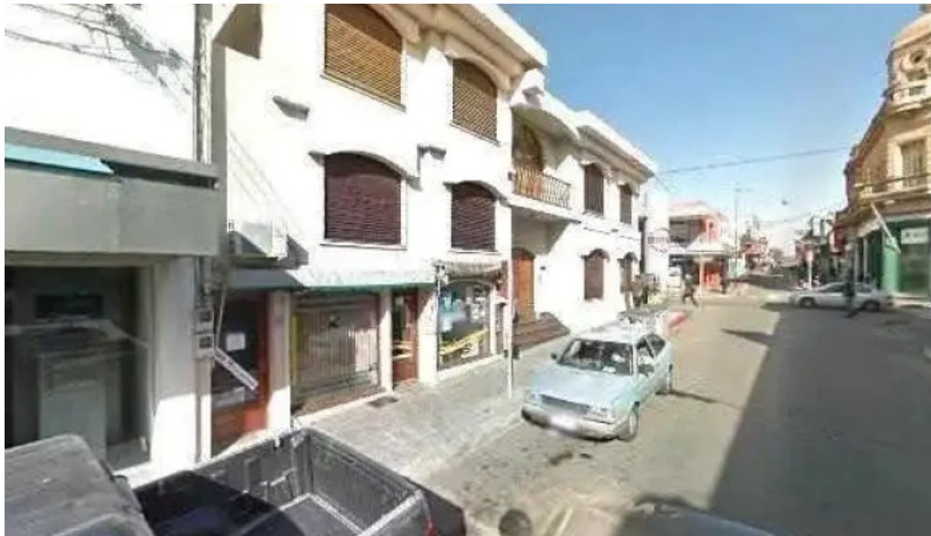
Redpagos y cambio central 25 de mayo direcciondeg