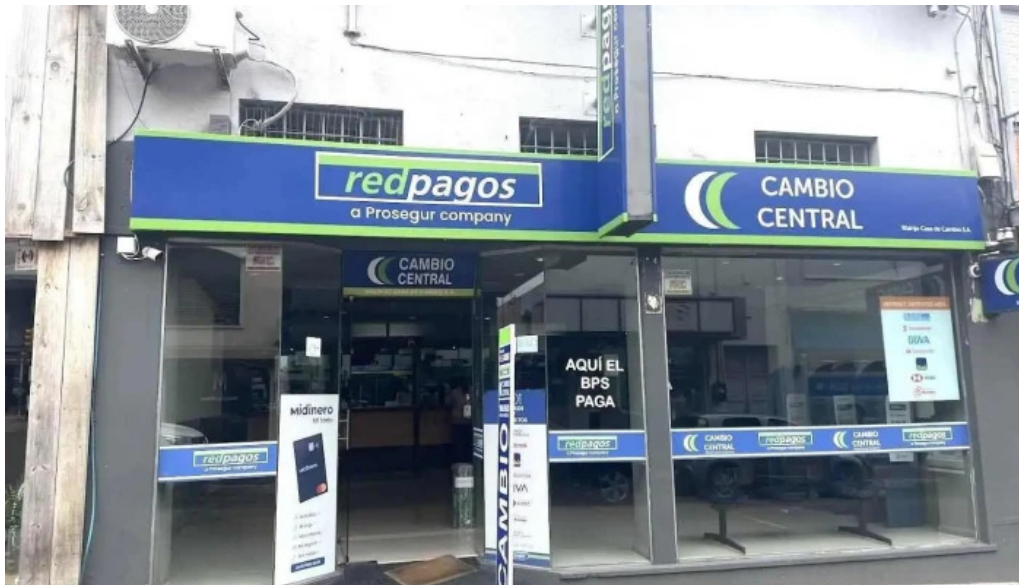
Redpagos y cambio central 25 de mayo minas