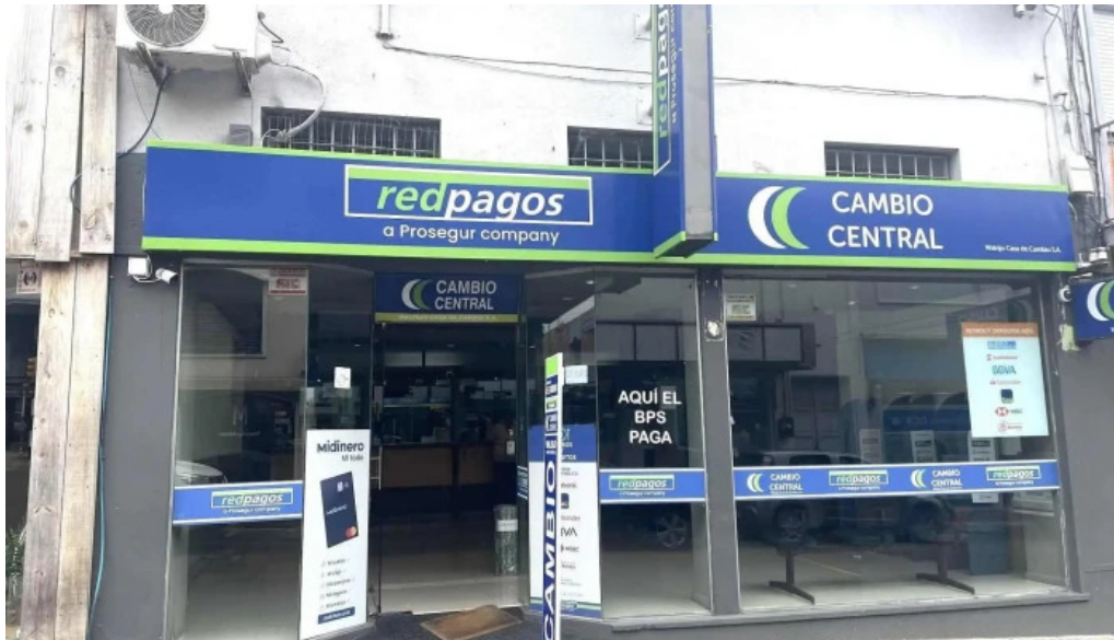
Redpagos y cambio central 25 de mayo direccion