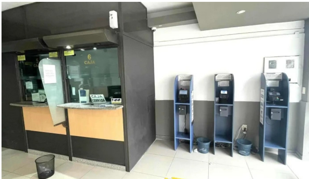
Redpagos y cambio central 25 de mayo del propietario