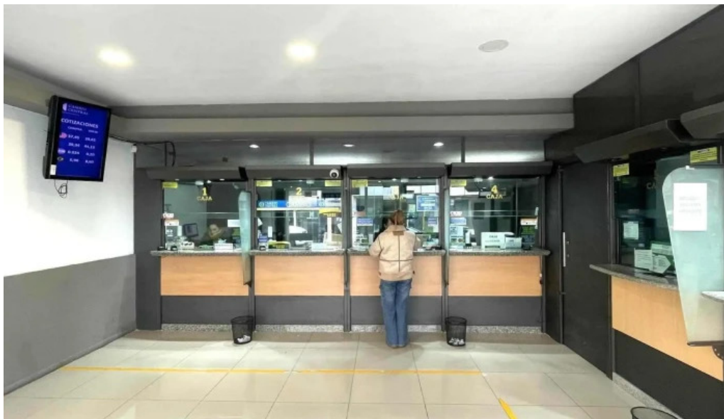
Redpagos y cambio central 25 de mayo interior