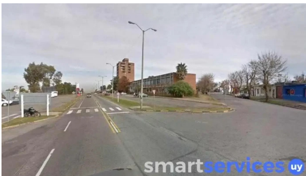
Abitab agencia 14 22 col del sacramento