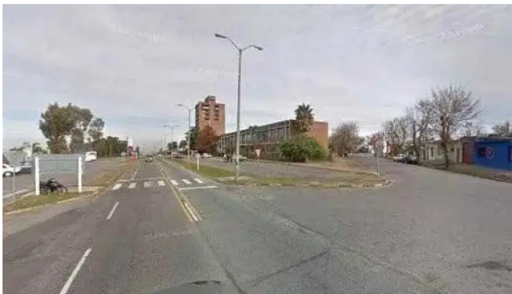
Abitab agencia 1422 direccion