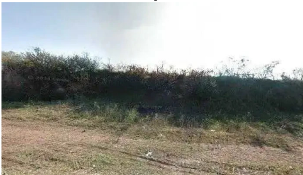
Planta emisora radio charrua cw 154 am 1540 paysandu uruguay sitio webdeg