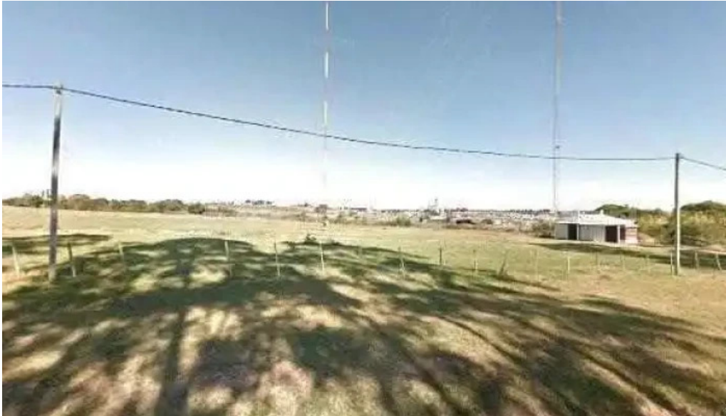
Planta emisora difusora soriano cx 121 am 1210 sitio webdeg