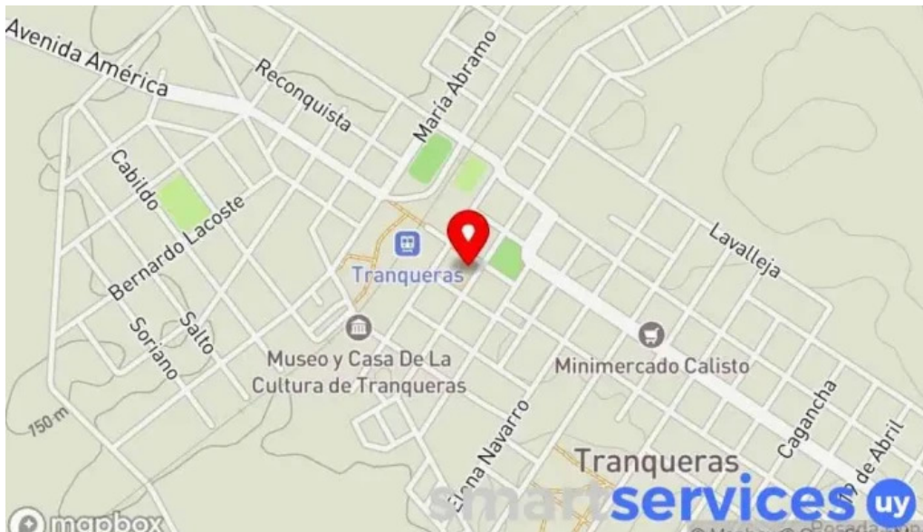
Liceo químico farmacéutico mario brum viana mapa