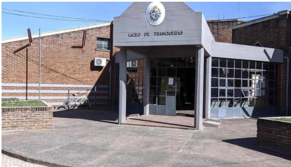
Liceo químico farmacéutico mario brum viana abierto ahora