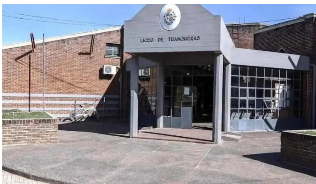
Liceo quimico farmaceutico mario brum viana tranqueas