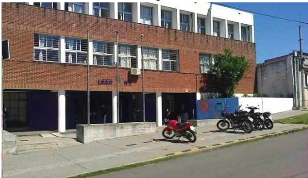
Liceo n° 5 profesor carlos maria thieulent rivera