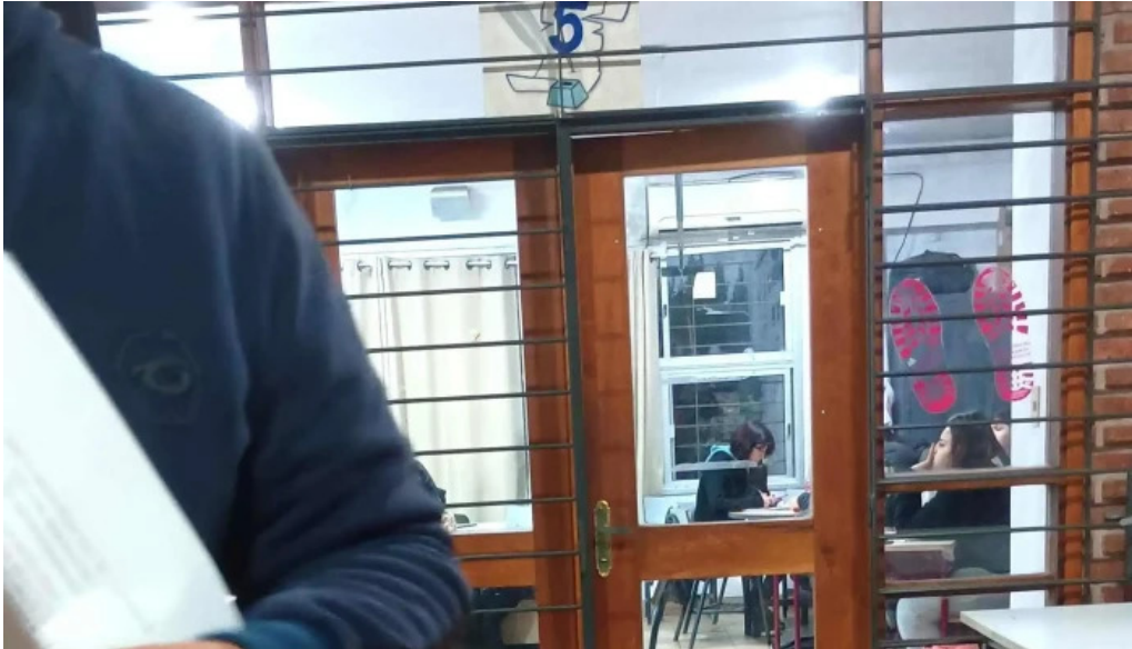
Liceo no 5 profesor carlos maria thieulent rivera