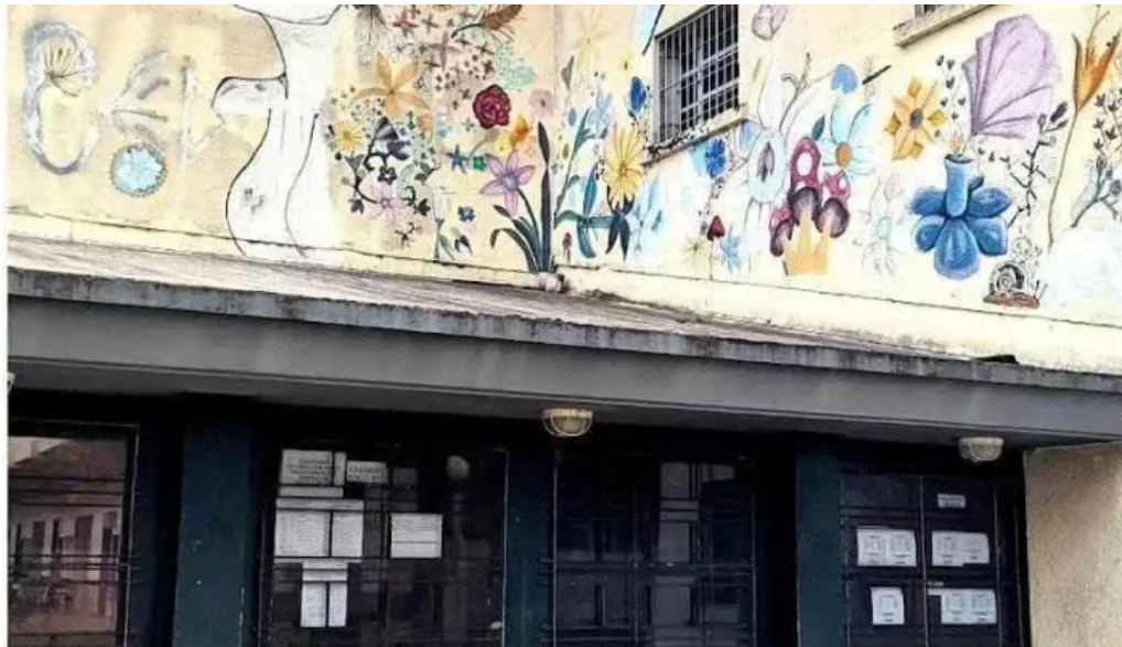
Liceo n° 1 instituto doctora celia pomoli rivera