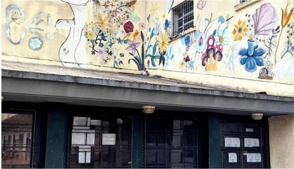
Liceo ndeg 1 instituto doctora celia pomoli puntaje