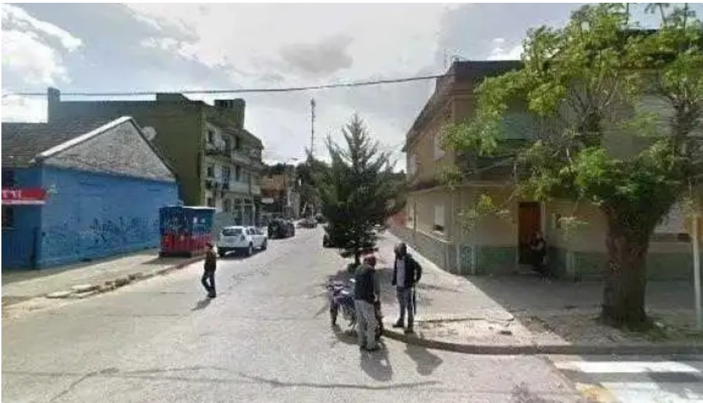
Liceo ndeg 1 instituto doctora celia pomoli puntajedeg