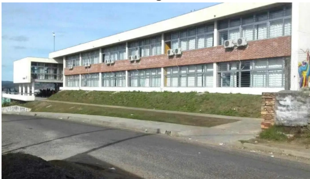
Liceo nº 3 dolores lolita rubial minas