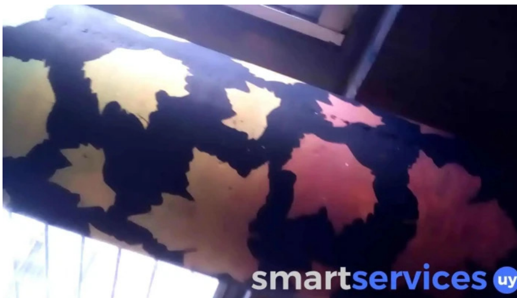
Liceo no 3 dolores lolita rubial videos