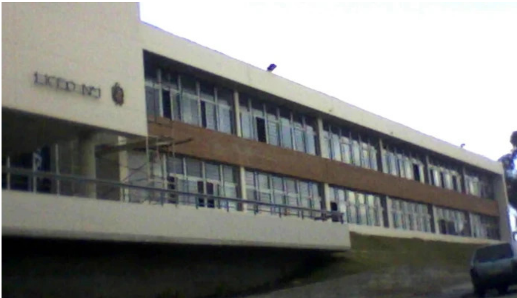
Liceo no 3 dolores lolita rubial minas