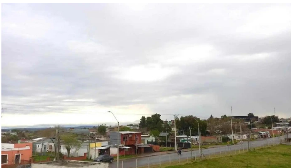
Liceo 4 antonio ma ubilla instagram