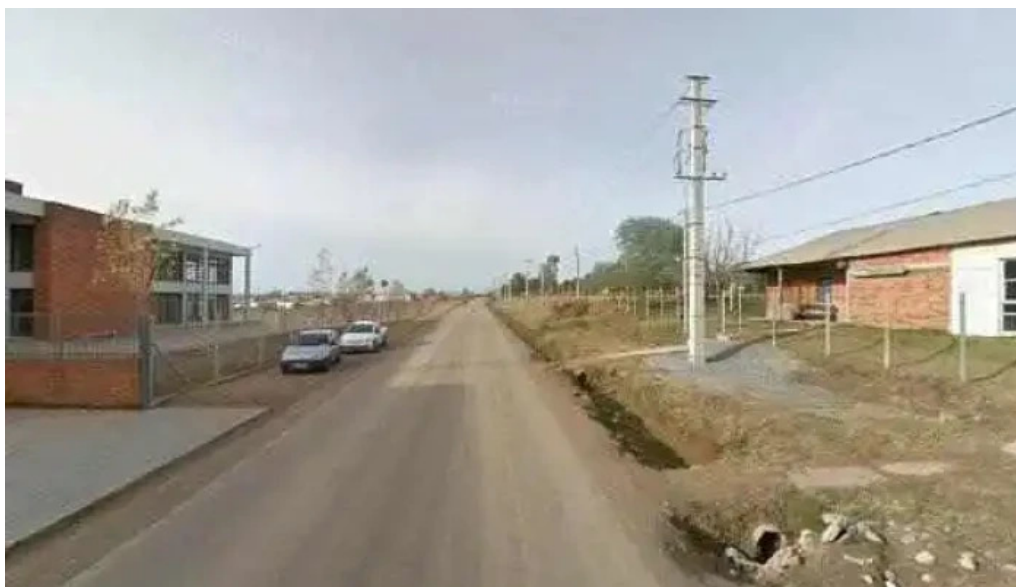
Liceo 4 antonio ma ubilla instagramdeg