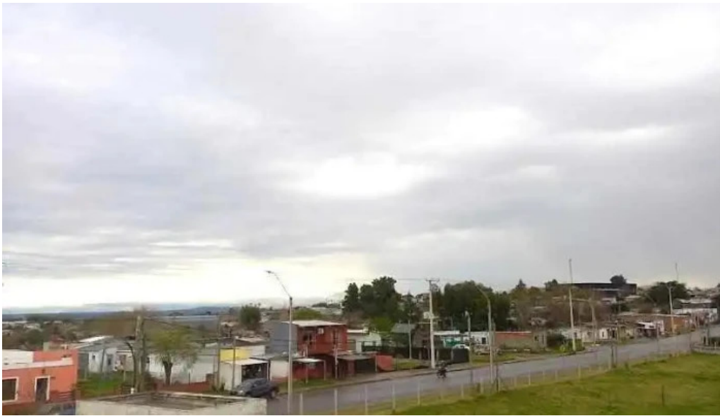
Liceo 4 antonio ma ubilla melo