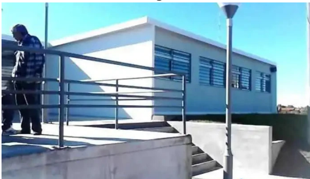
Liceo nº 5 de las piedras las piedras