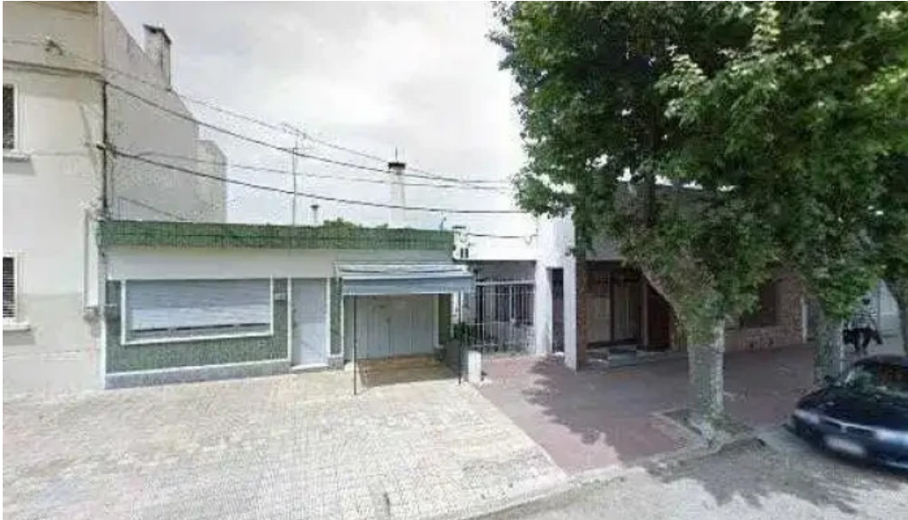
Redpagos saucedo descuentos