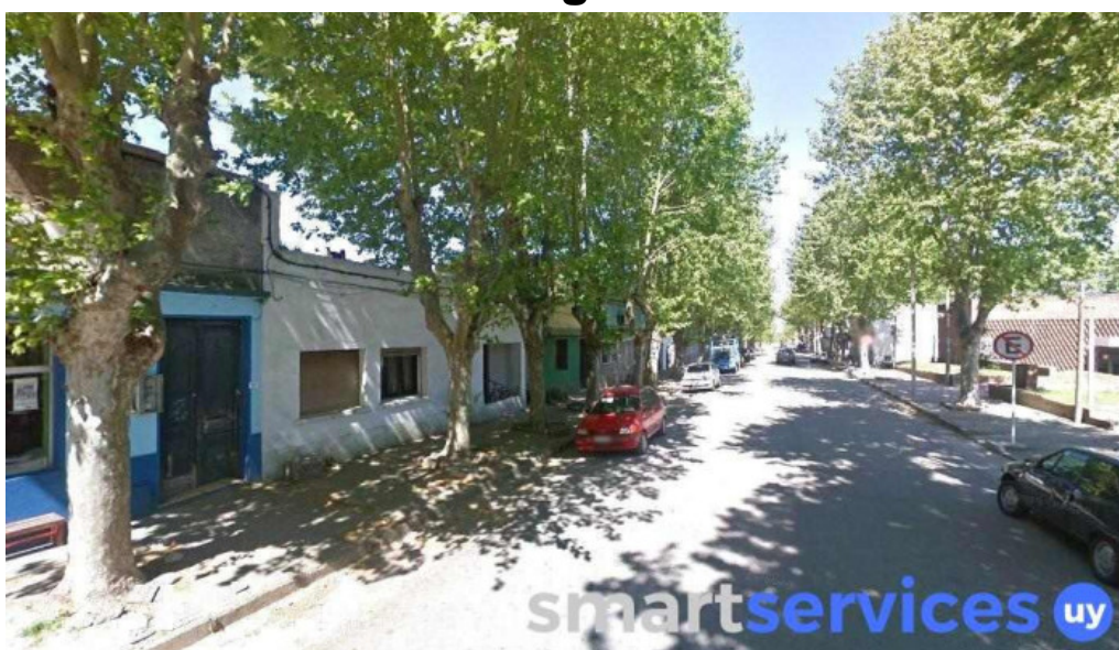
Abitab sarandi del yi