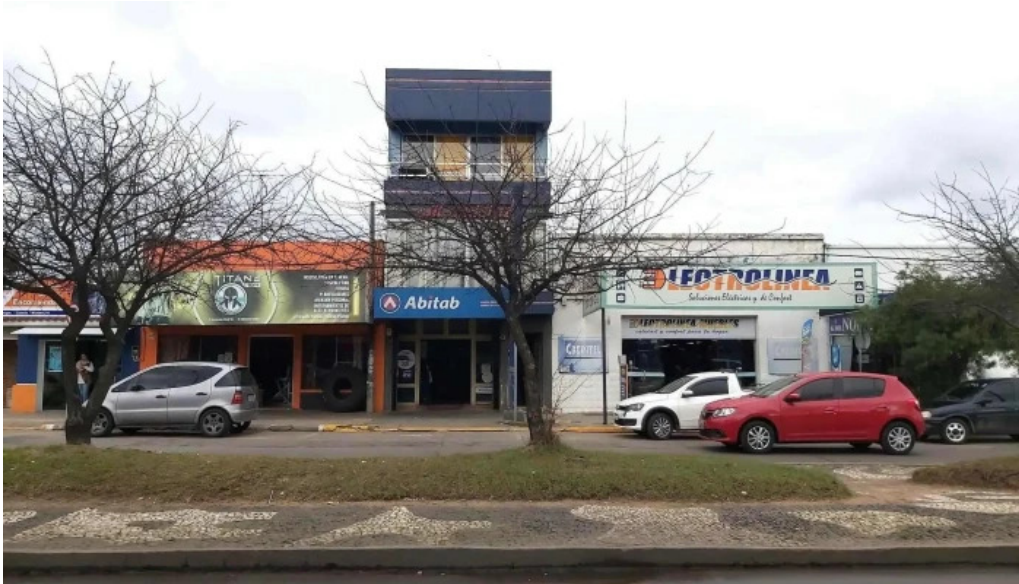
Abitab 2312 telefono