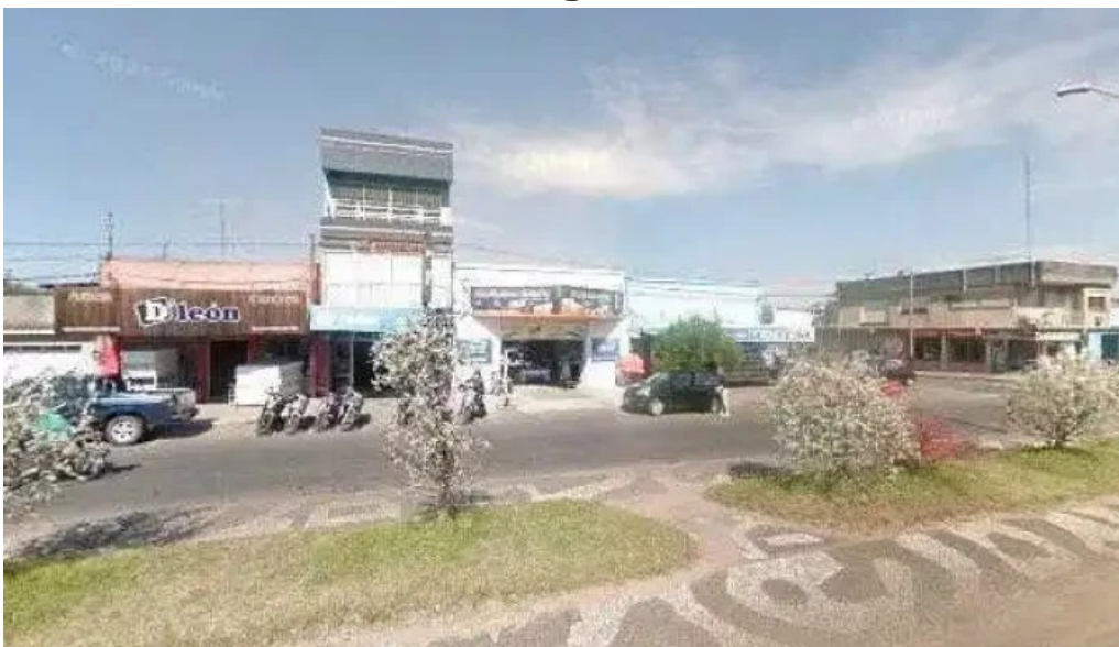
Abitab 2312 telefonodeg