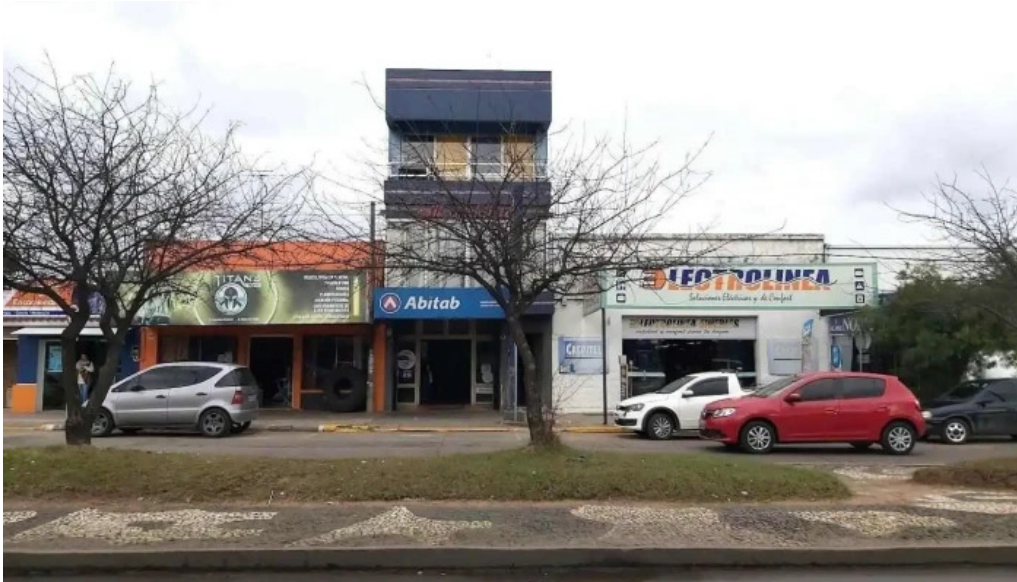
Abitab 23 12 rivera