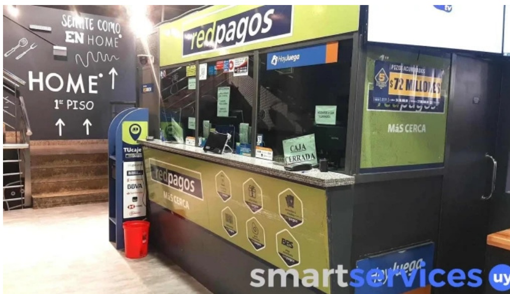
Redpagos devoto 26 de marzo como llegar