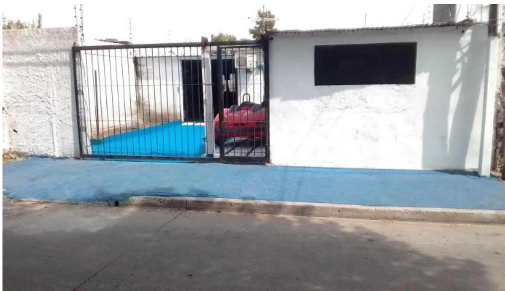
Herrería la fragua del propietario