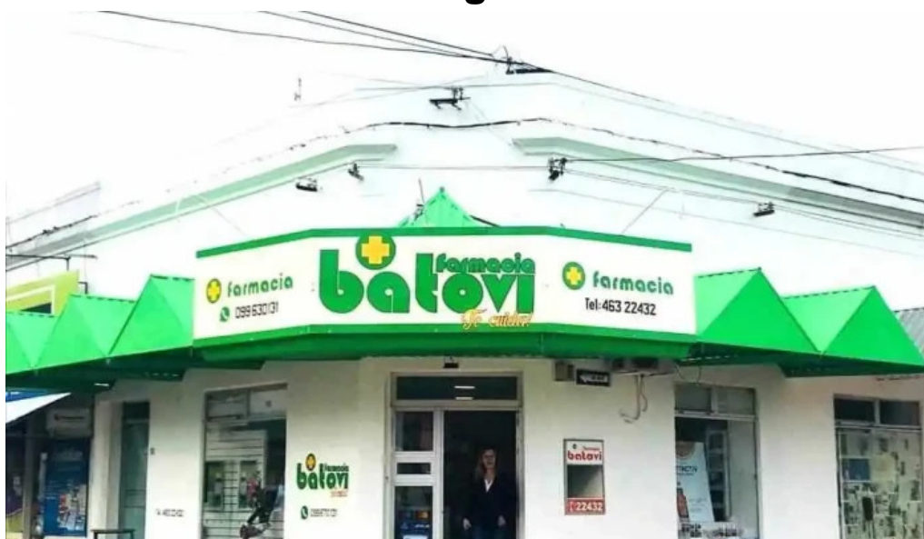
Farmacia batovi tacuarembó