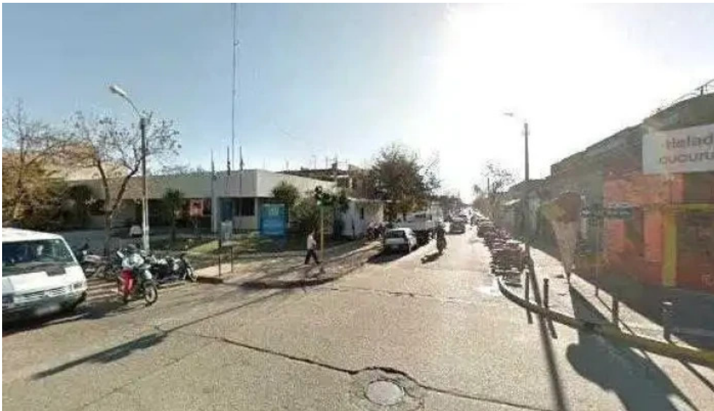
Farmacia batovi opiniones