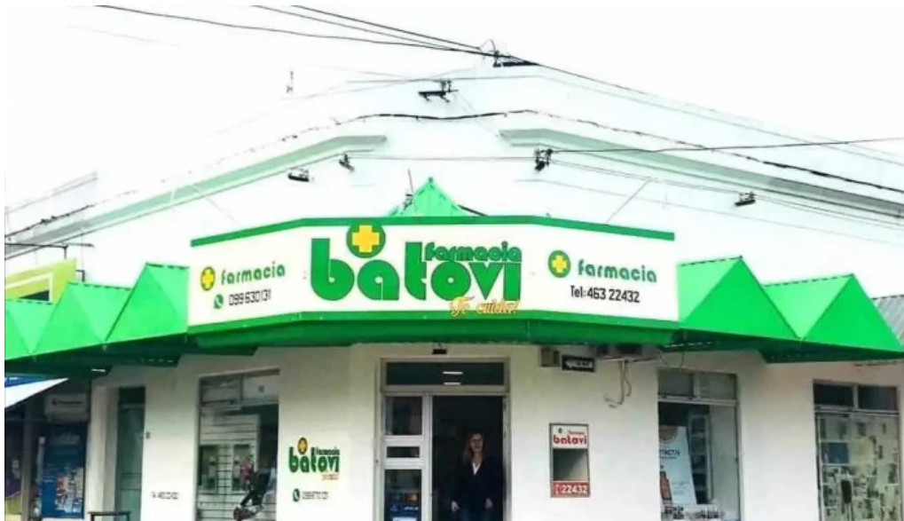
Farmacia batovi farmacia