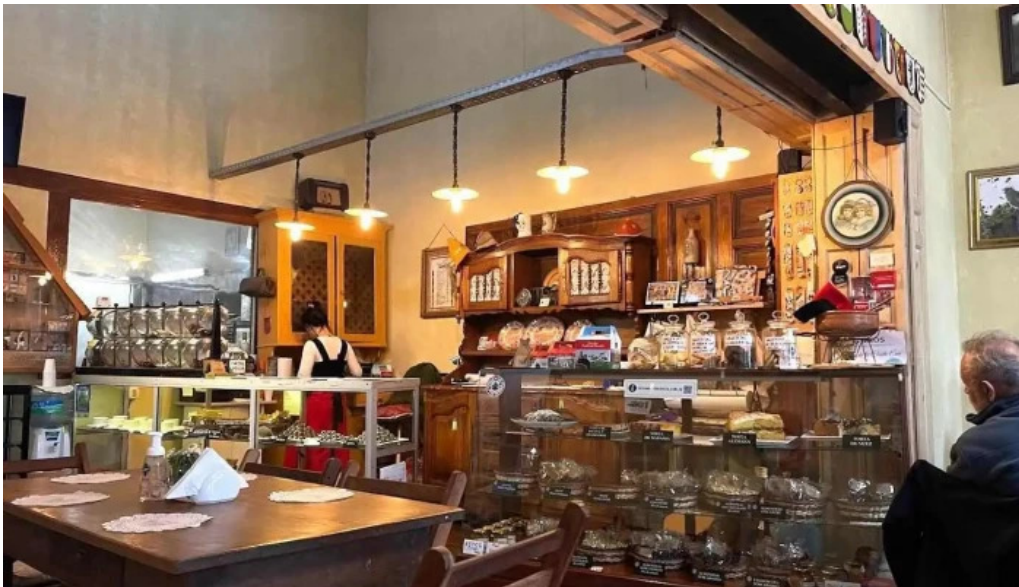
Farmacia abuelita nueva helvecia