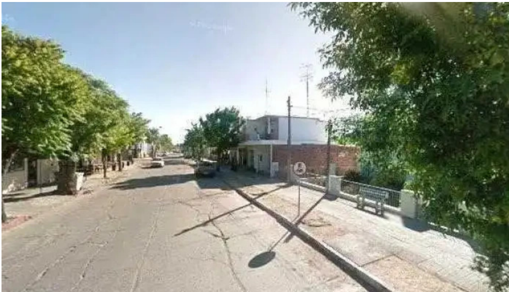
Farmacia abuelita puntaje