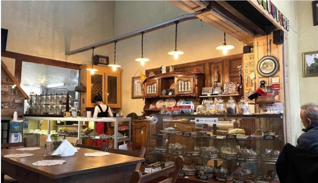
Farmacia abuelita farmacia