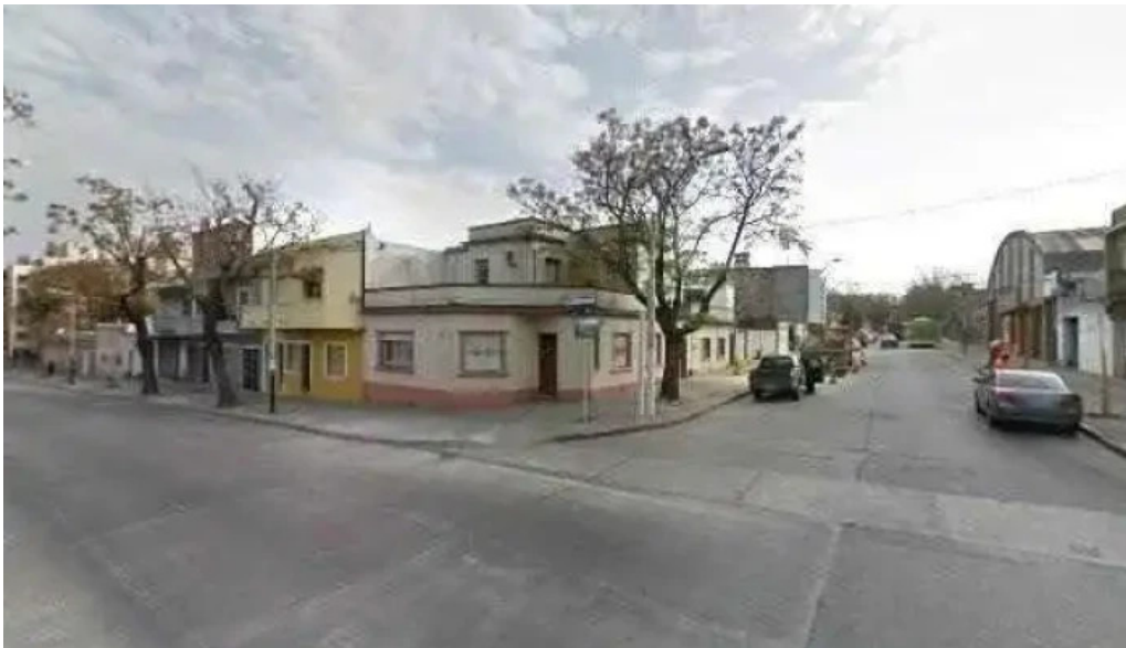
Farmacia moderna ii donde