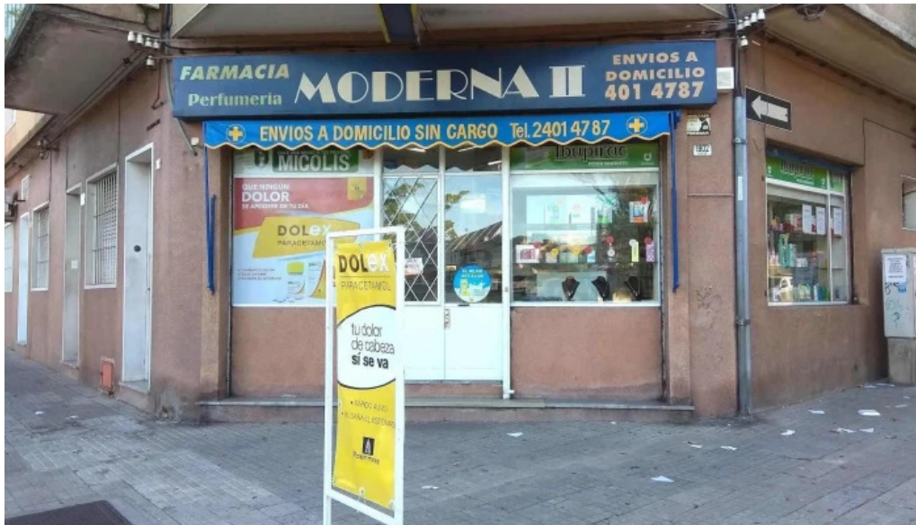
Farmacia moderna ii farmacia