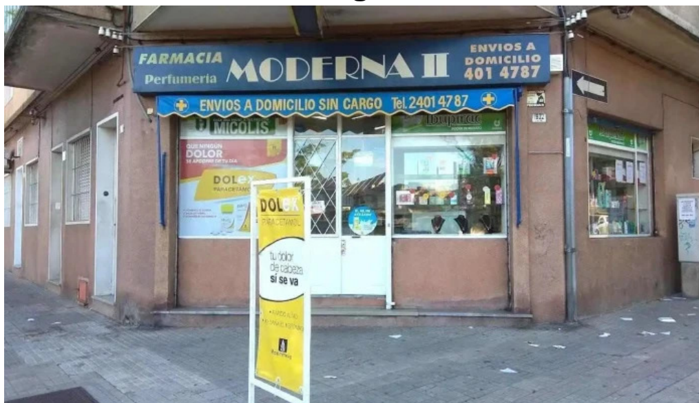
Farmacia moderna ii montevideo