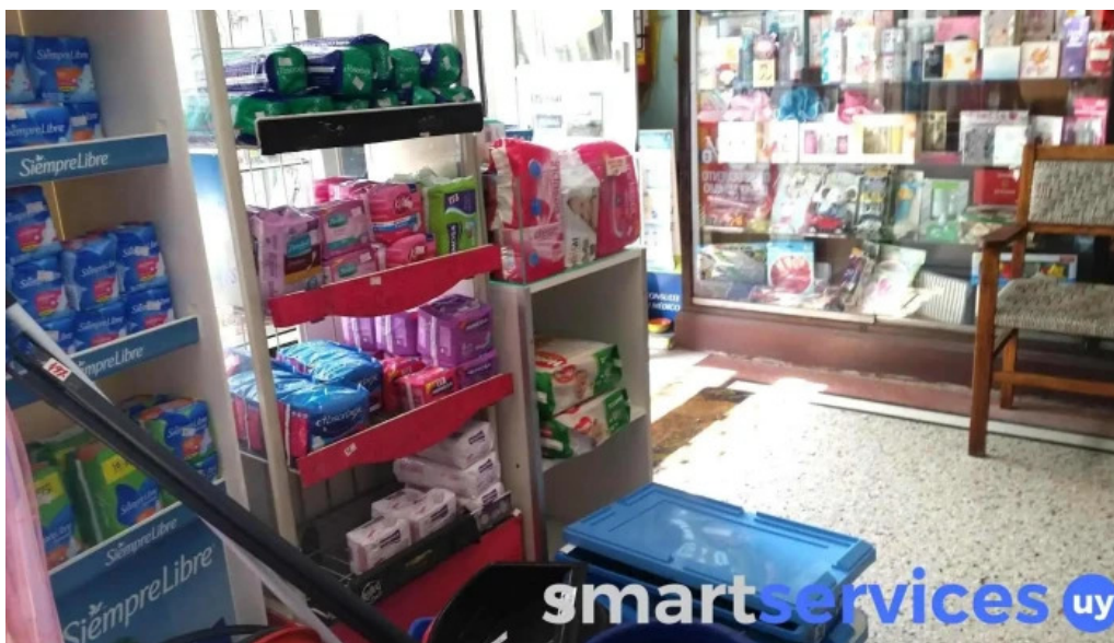
Farmacia americana montevideo