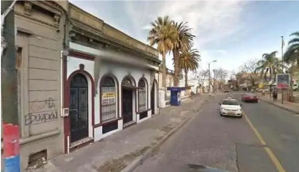
Farmacia americana ubicacion