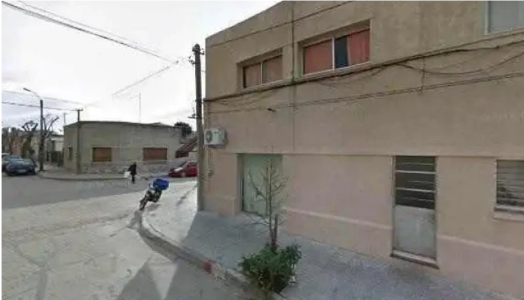
Farmacia comunidad farmacia