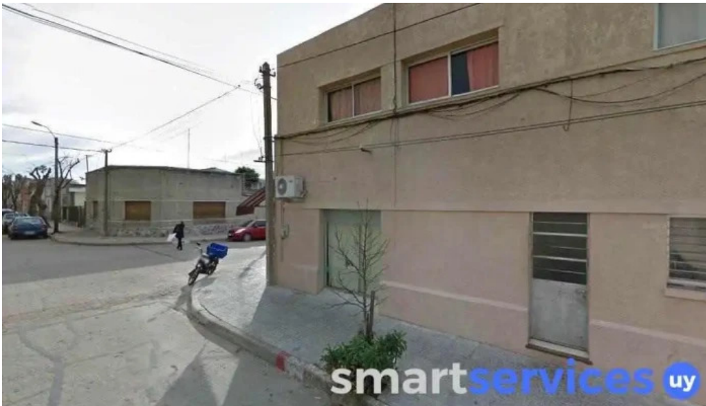
Farmacia comunidad melo