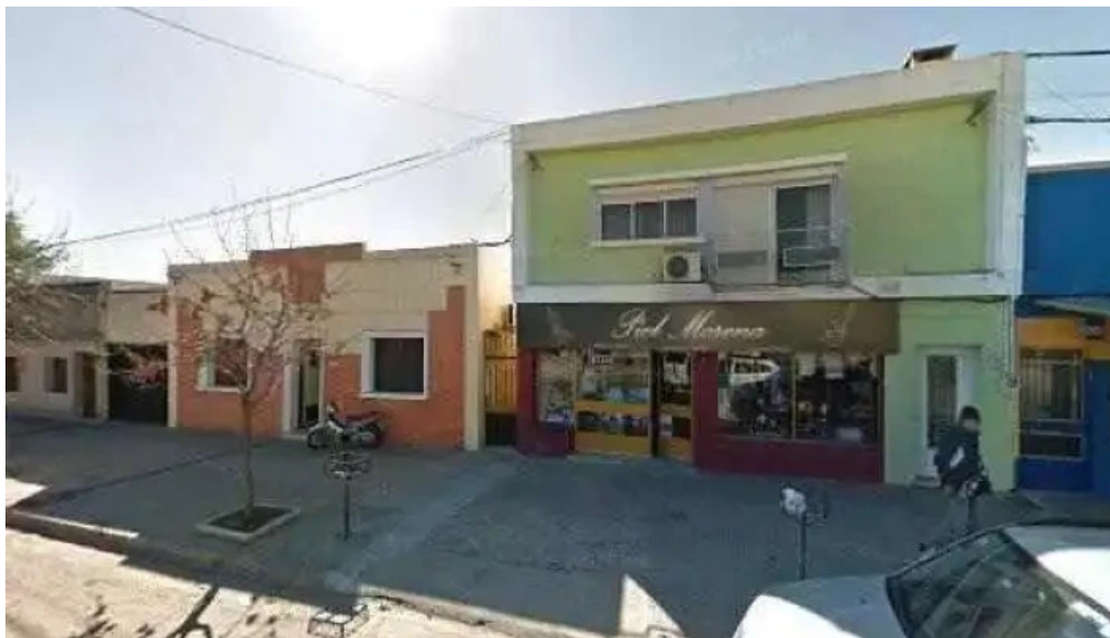
Farmacia octava farmacia