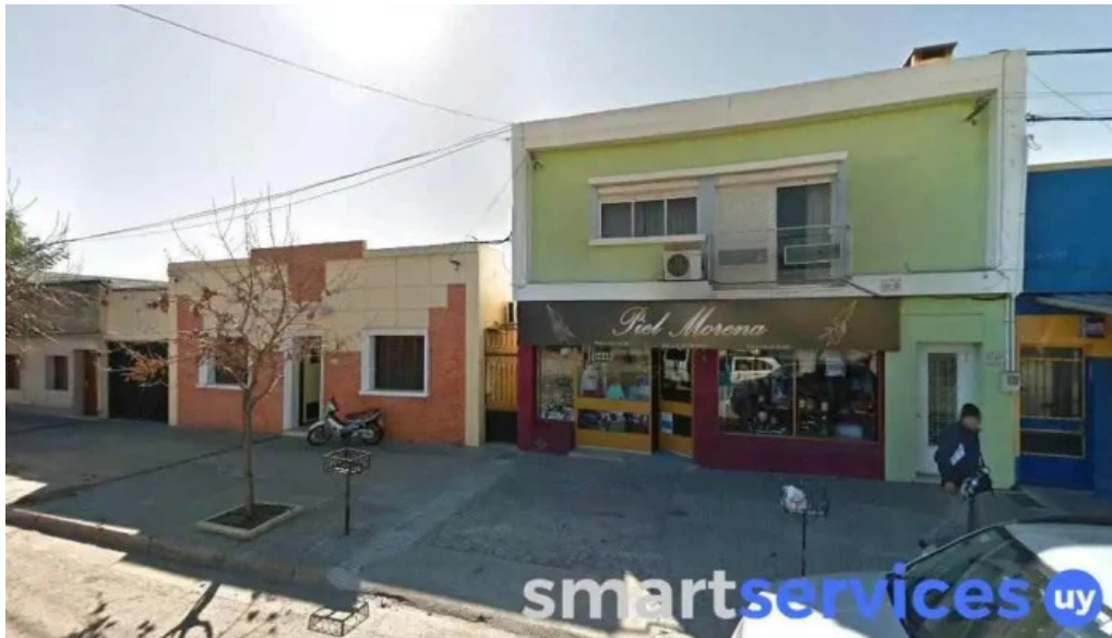
Farmacia octava fray bentos