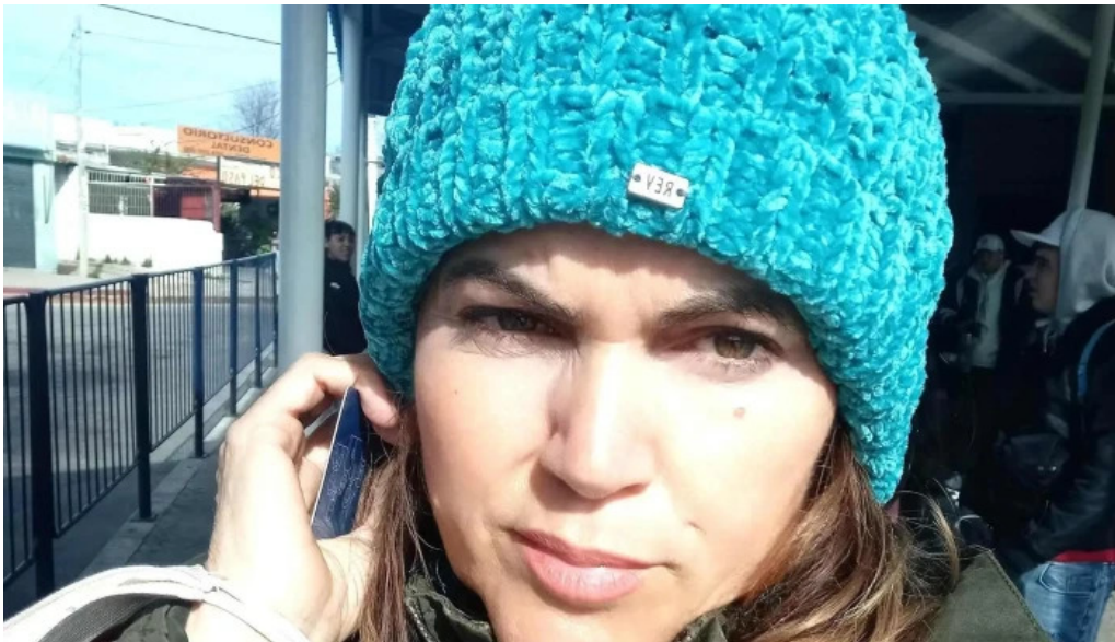
Terminal paso de la arena comentarios