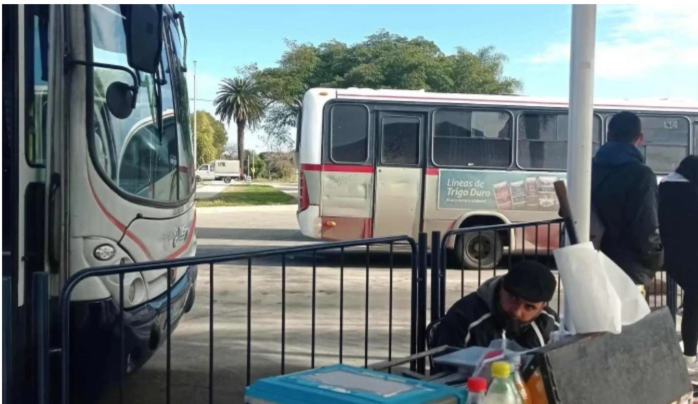
Terminal paso de la arena zona