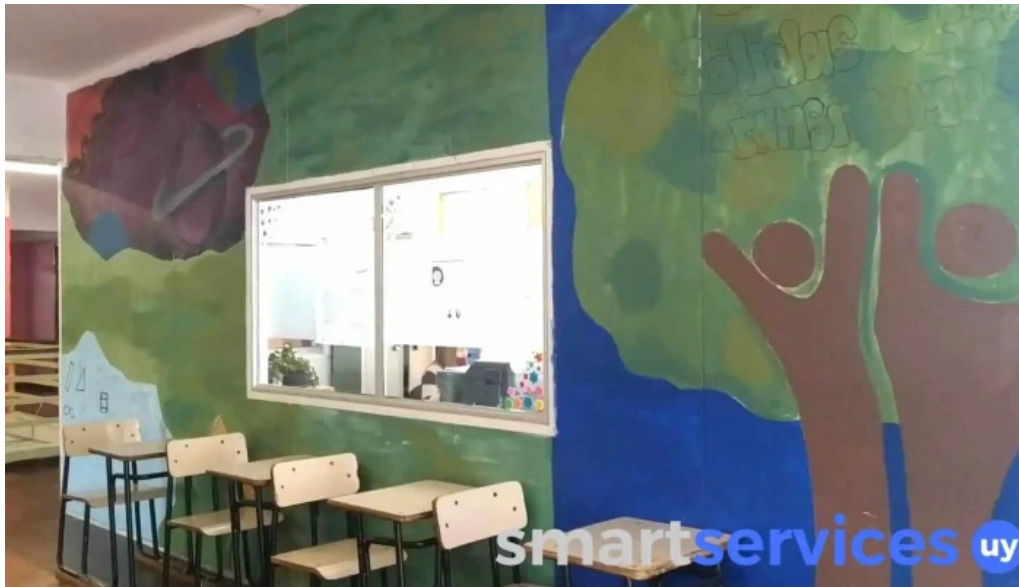
Liceo 2 timbo videos