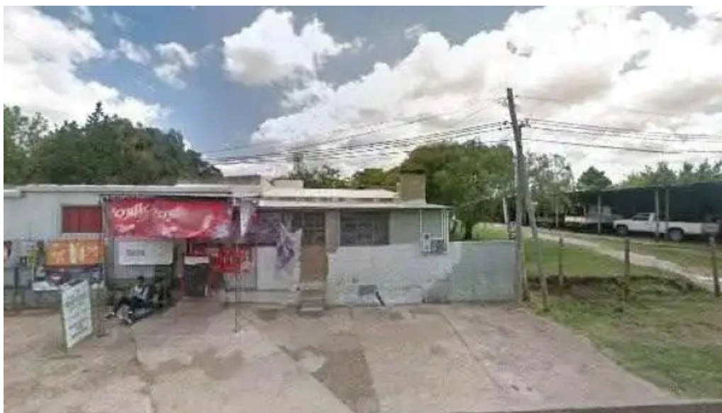
Liceo 2 timbo como llegardeg