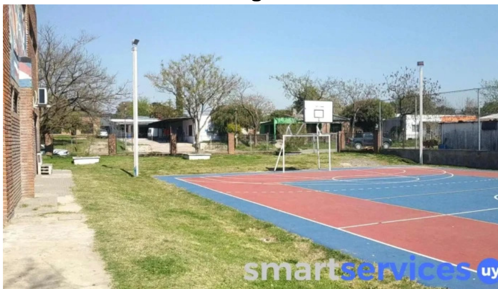
Liceo 2 timbo young