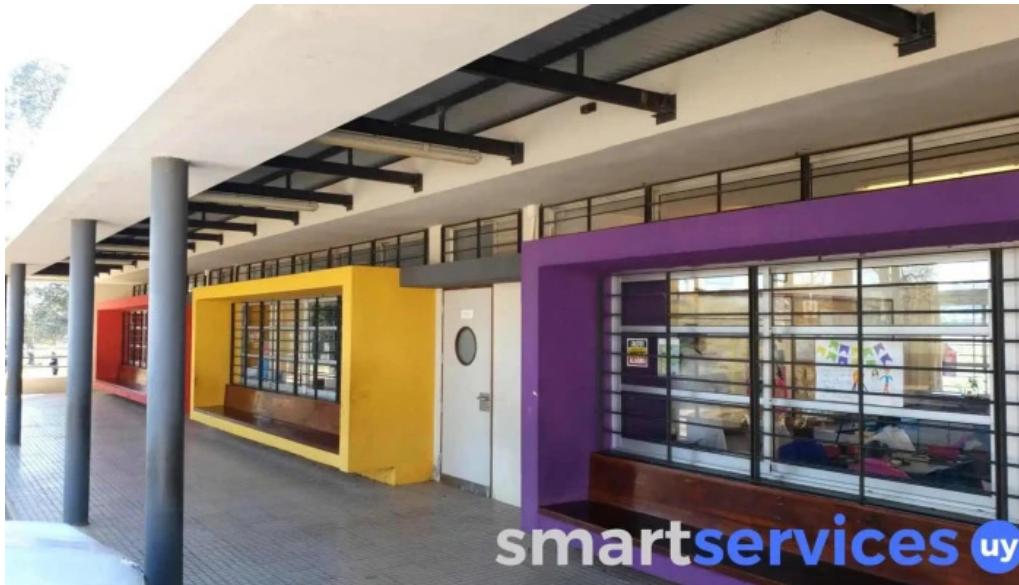
Escuela ndeg 37 puntas de cunapiru edificio