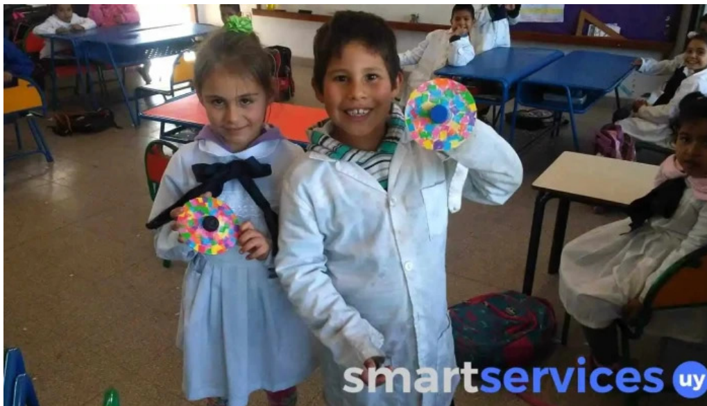
Escuela ndeg 37 puntas de cunapiru estudiante