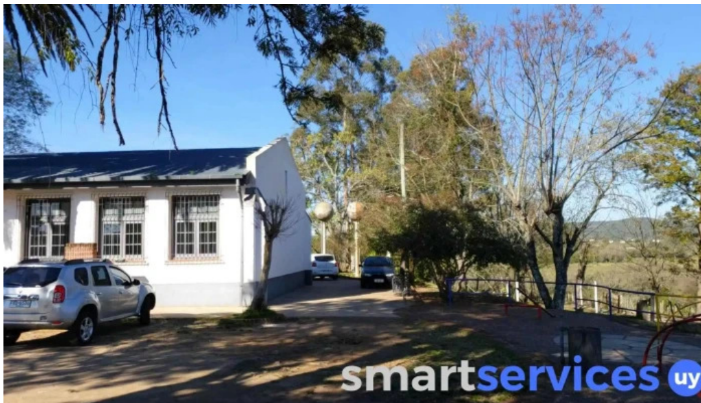
Escuela ndeg 37 puntas de cunapiru direccion