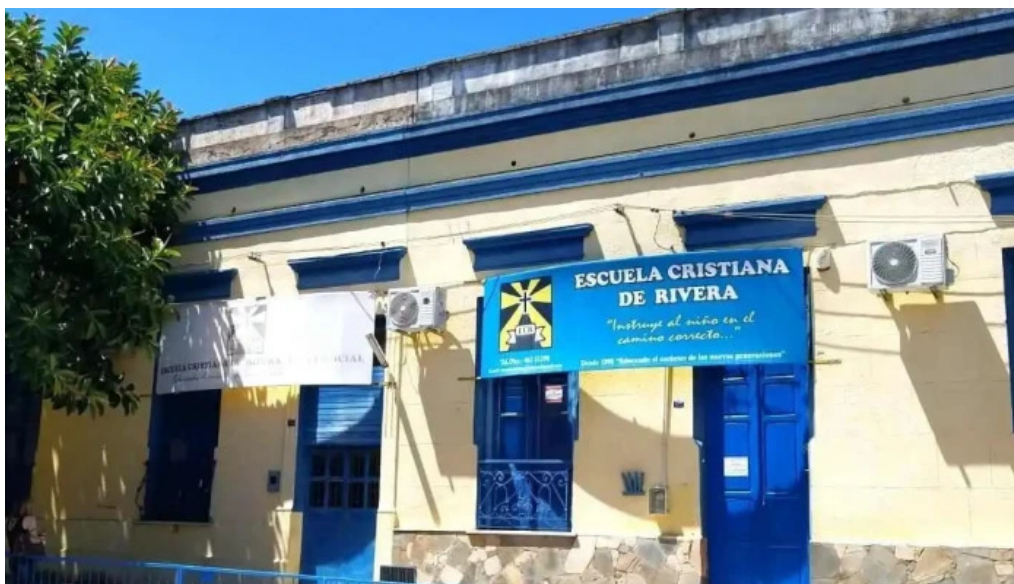
Escuela cristiana de rivera direccion