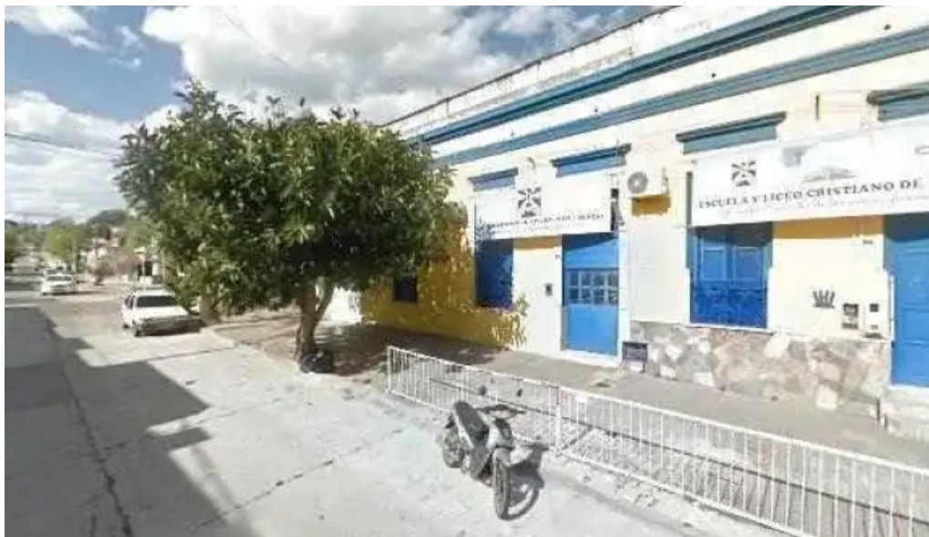
Escuela cristiana de rivera direcciondeg