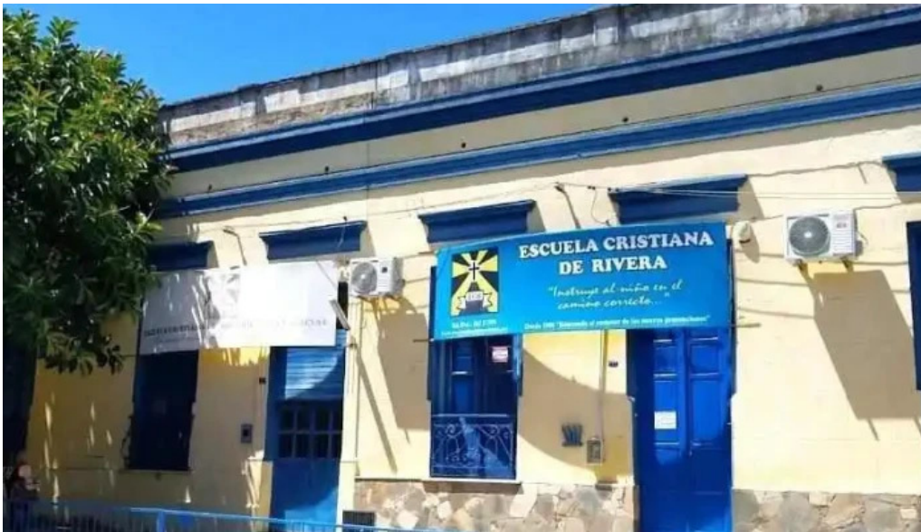
Escuela cristiana de rivera rivera