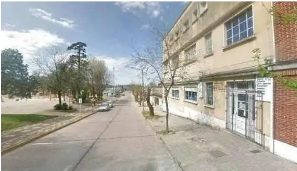
Colegio Juan Pablo II teléfono