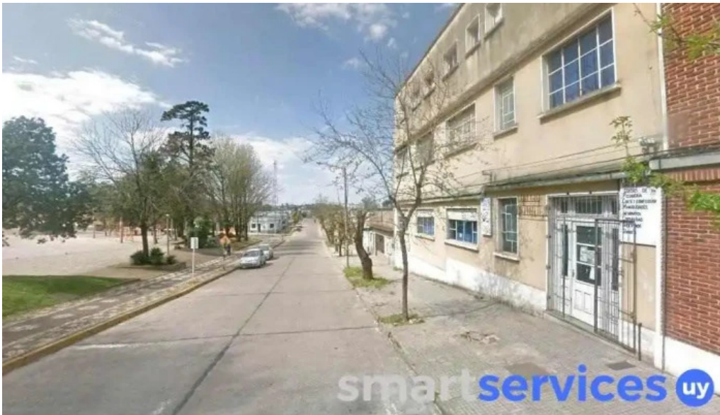
Colegio Juan Pablo II Rivera