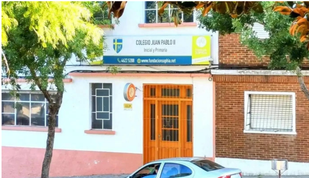
Colegio juan pablo ii edificio