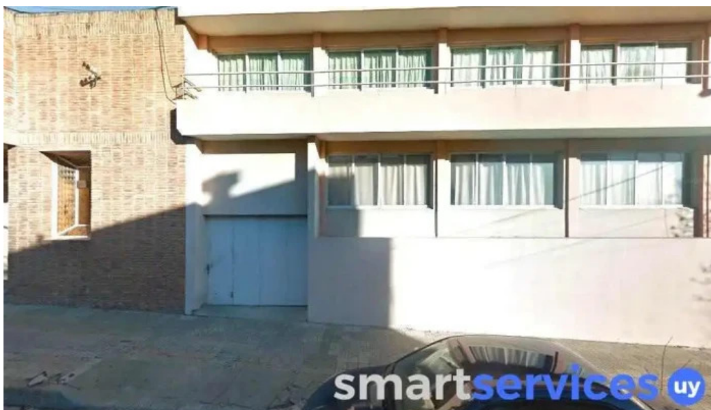
Liceo los candiles paysandu