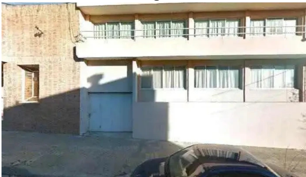
Liceo los candiles telefono