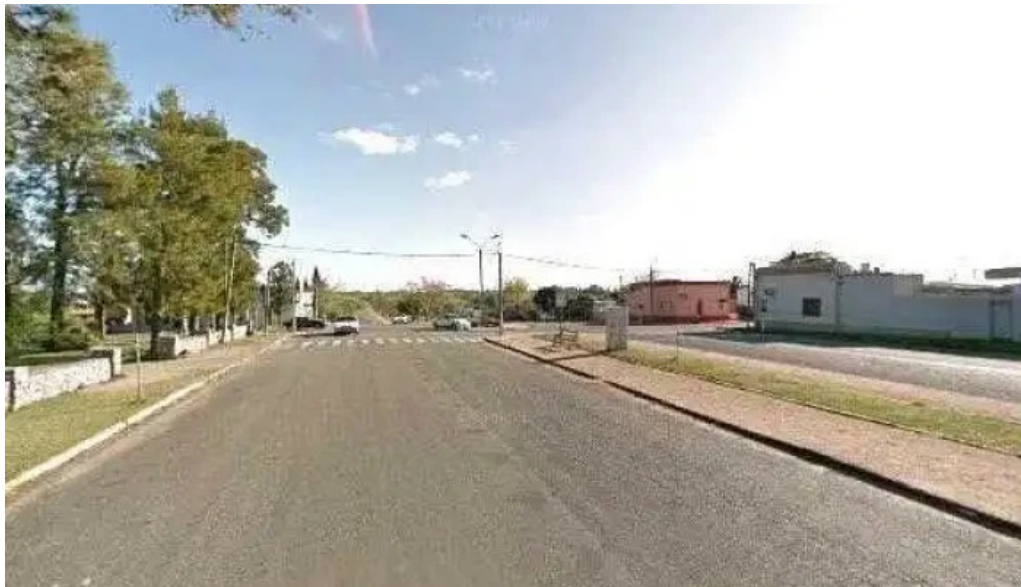
Liceo auic de rosario como llegardeg