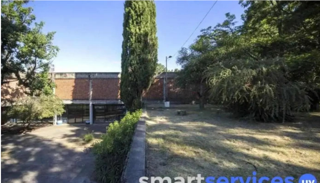
Liceo auic de rosario como llegar