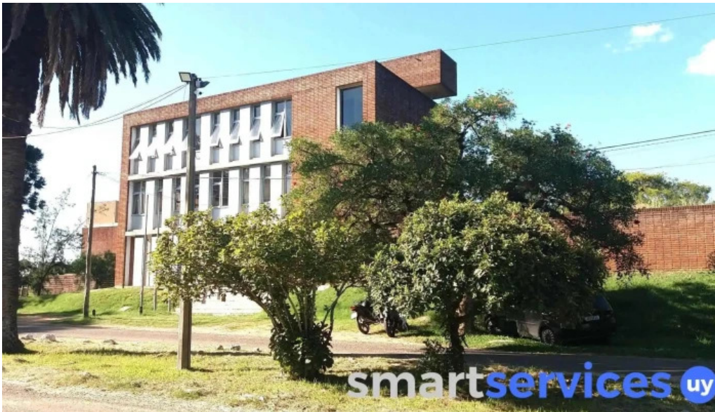
Polo educativo tecnologico rivera puntaje