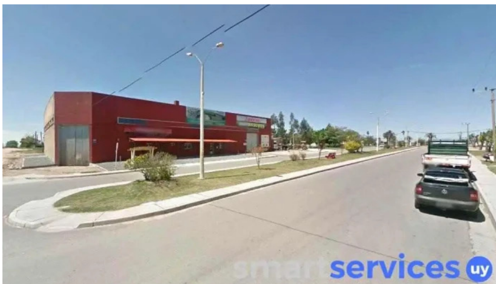
Liceo sarandi del yi