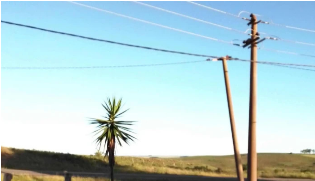
Radio vichadero puntaje