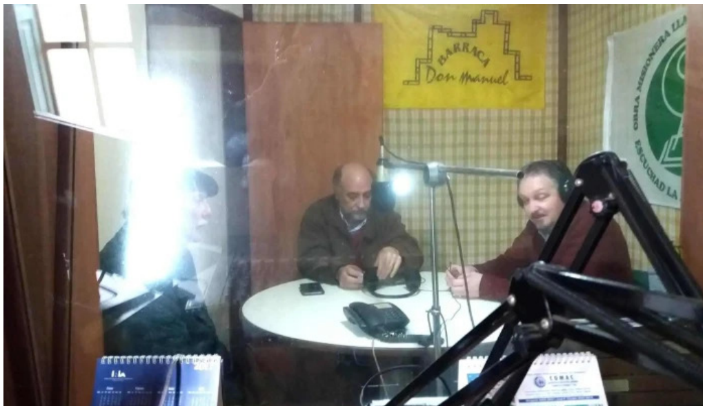
Radio el libertador interior