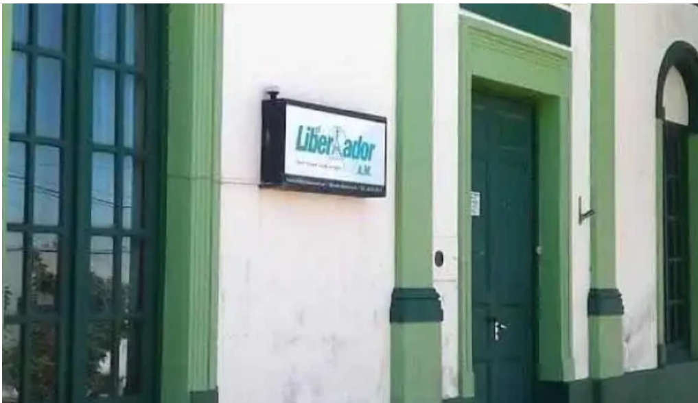
Radio el libertador vergara