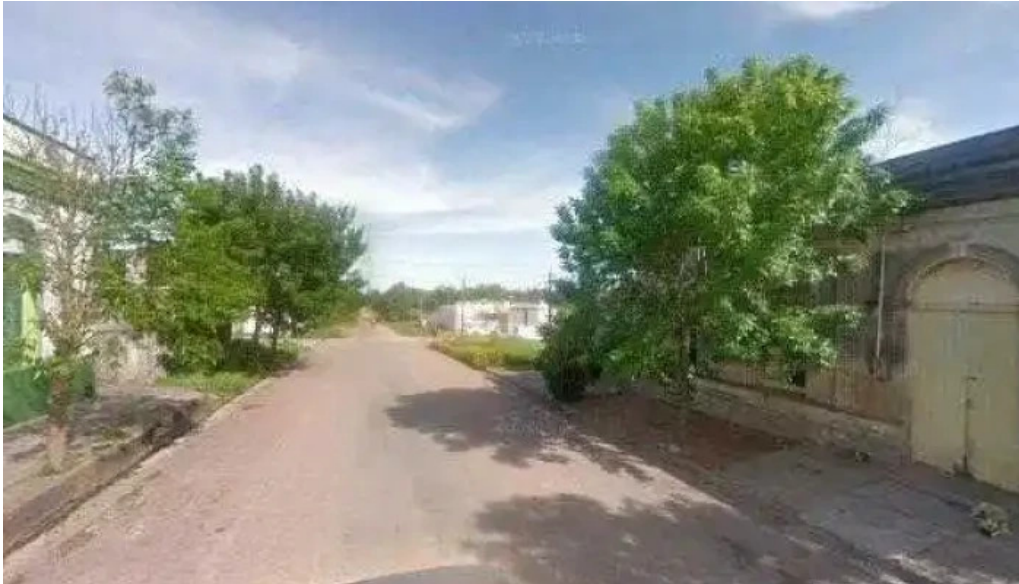
Radio el libertador cerca de mideg