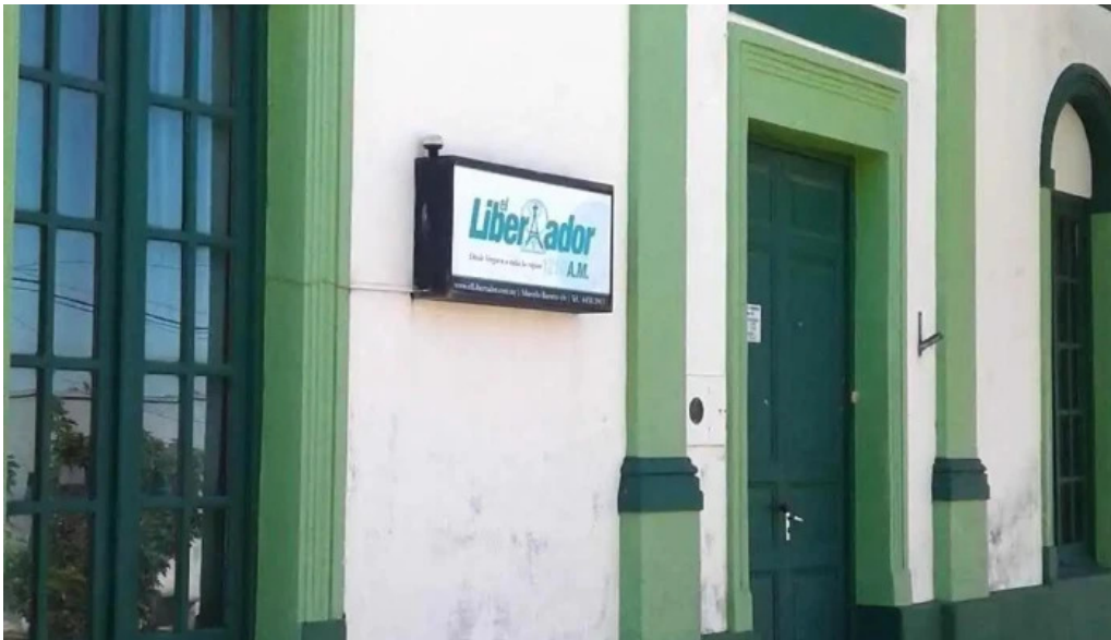
Radio el libertador cerca de mi