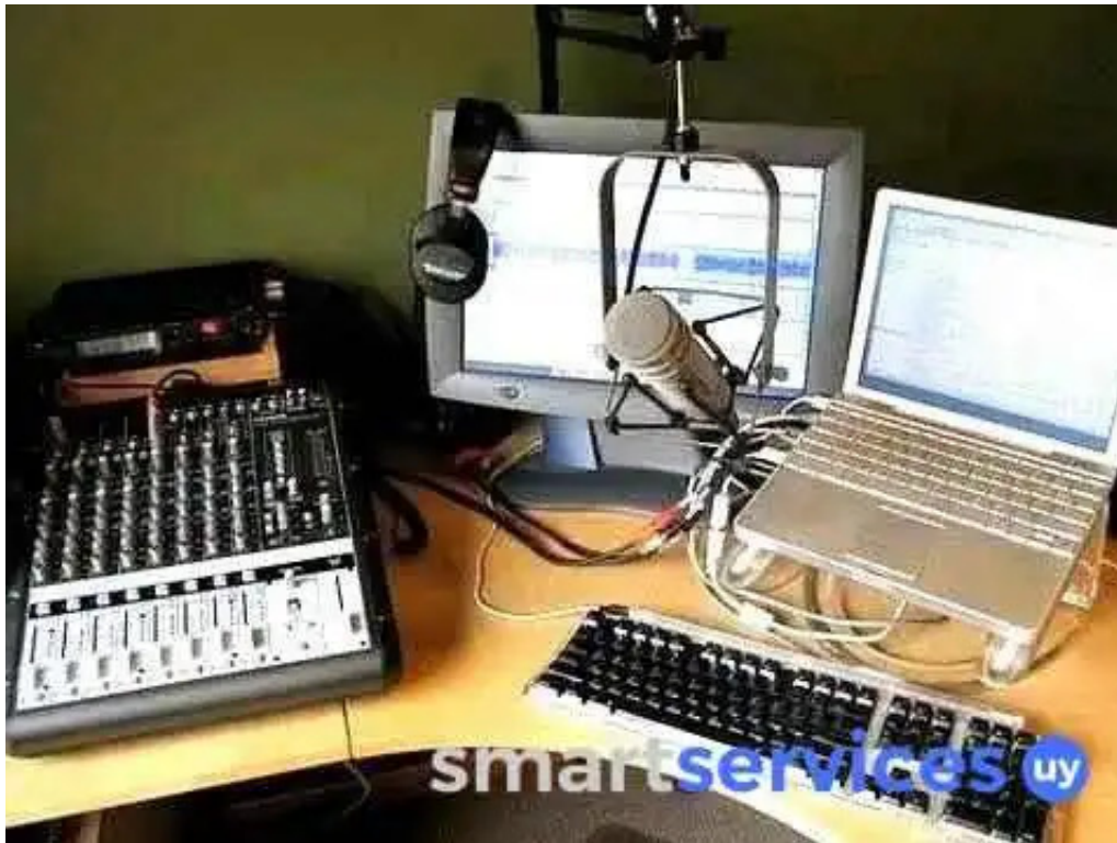
Fm sintonia 106 3 santa rosa