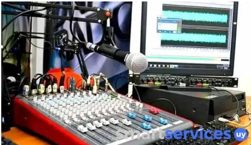
Fm sintonia 1063 del propietario