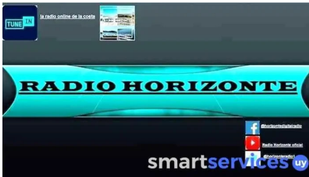
Horizonte comunicacion donde