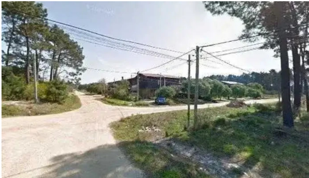
Horizonte comunicacion dondedeg