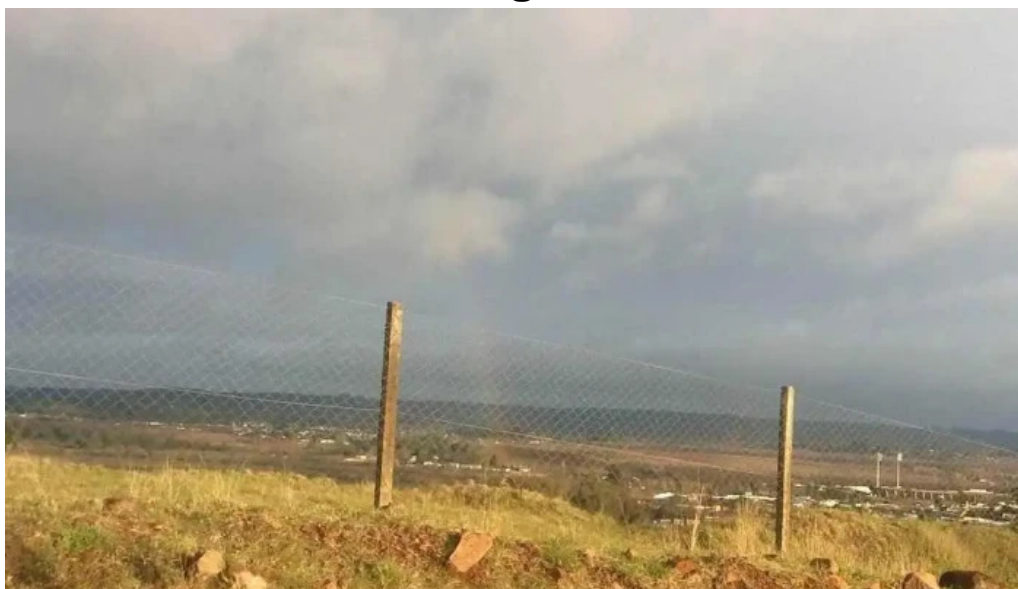
Planta emisora radio internacional cw 43 b am 1480 sitio web