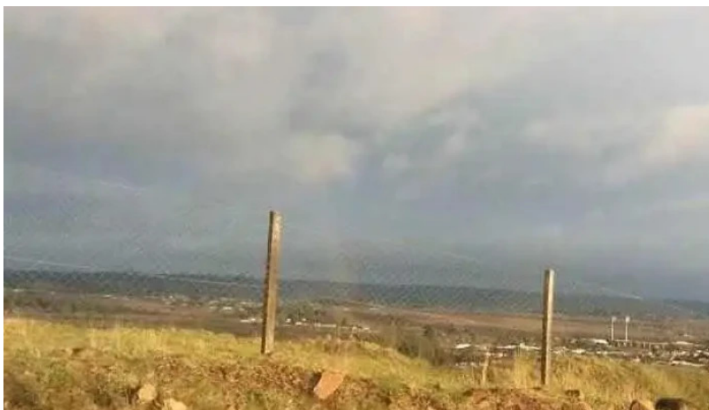
Planta emisora radio internacional cw 43 b am 1480 rivera