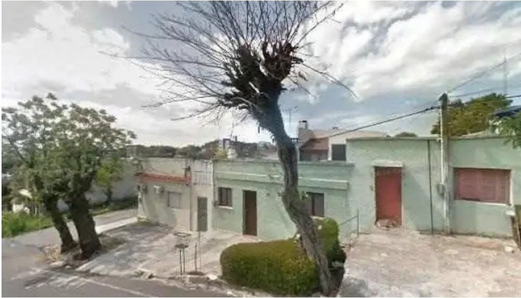
Fm columbia ubicacion