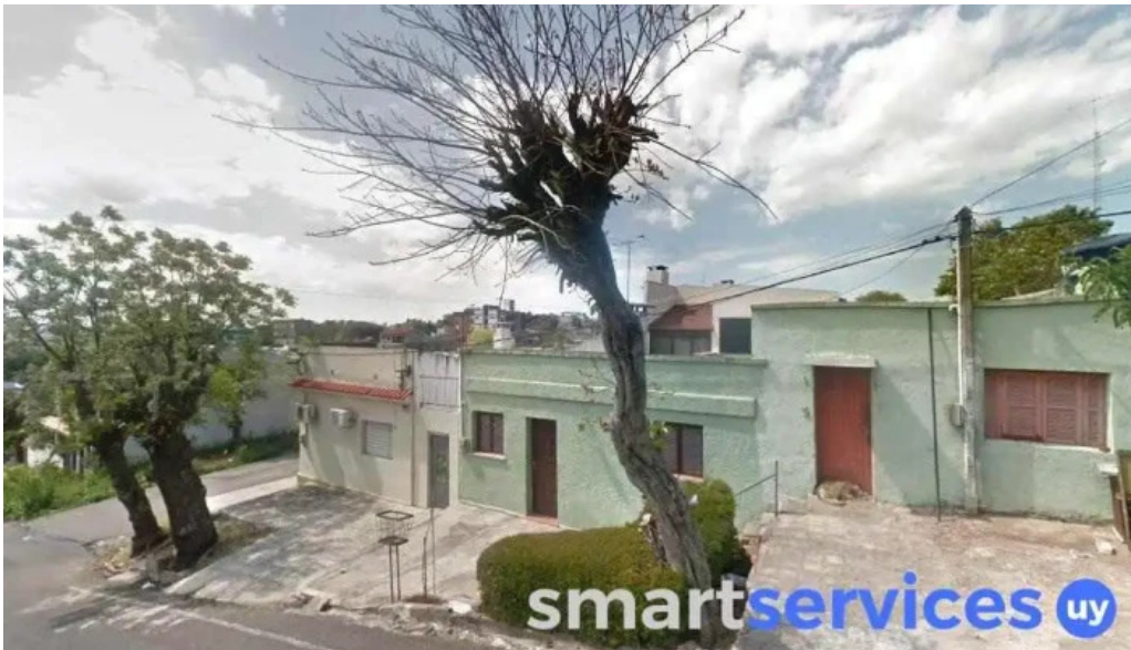
Fm columbia rivera