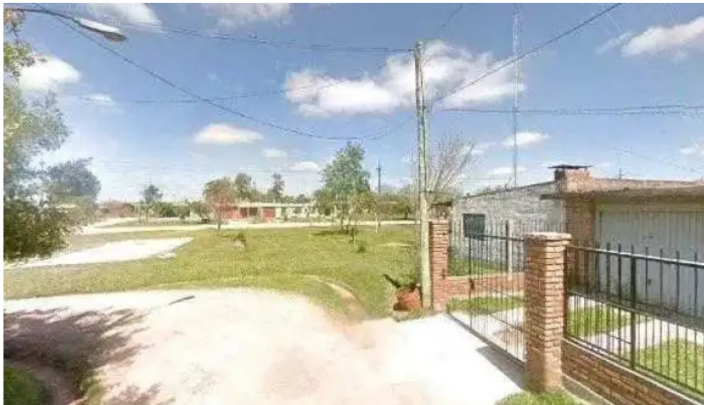
Radiopueblo fm 897 cerca de mideg