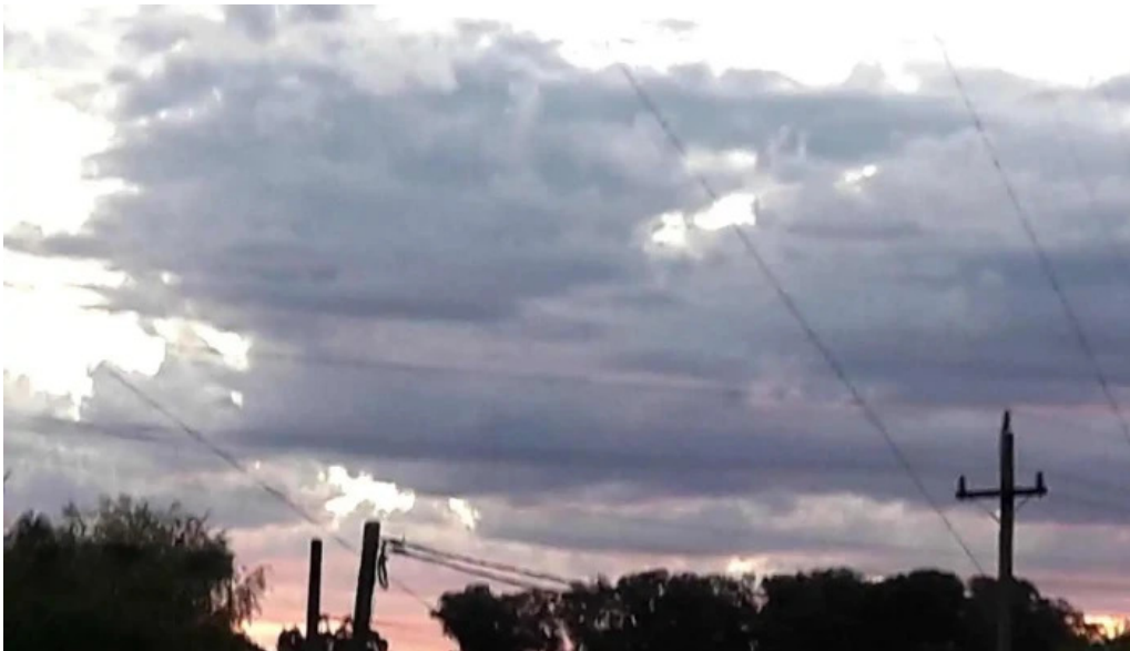
Radiopueblo fm 89 7 rio branco