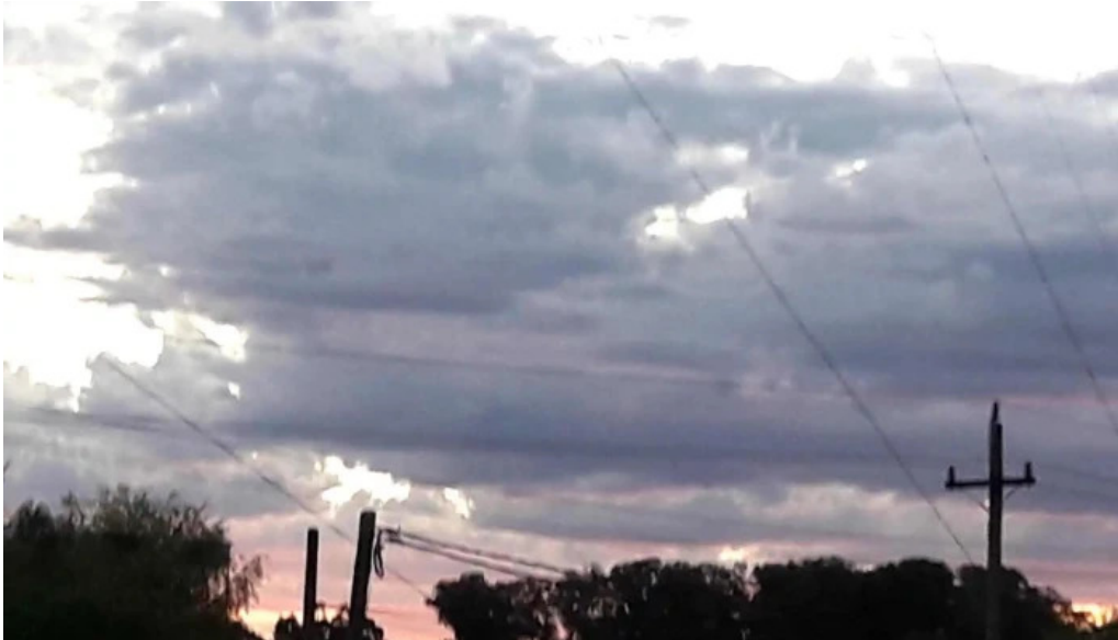
Radiopueblo fm 897 cerca de mi