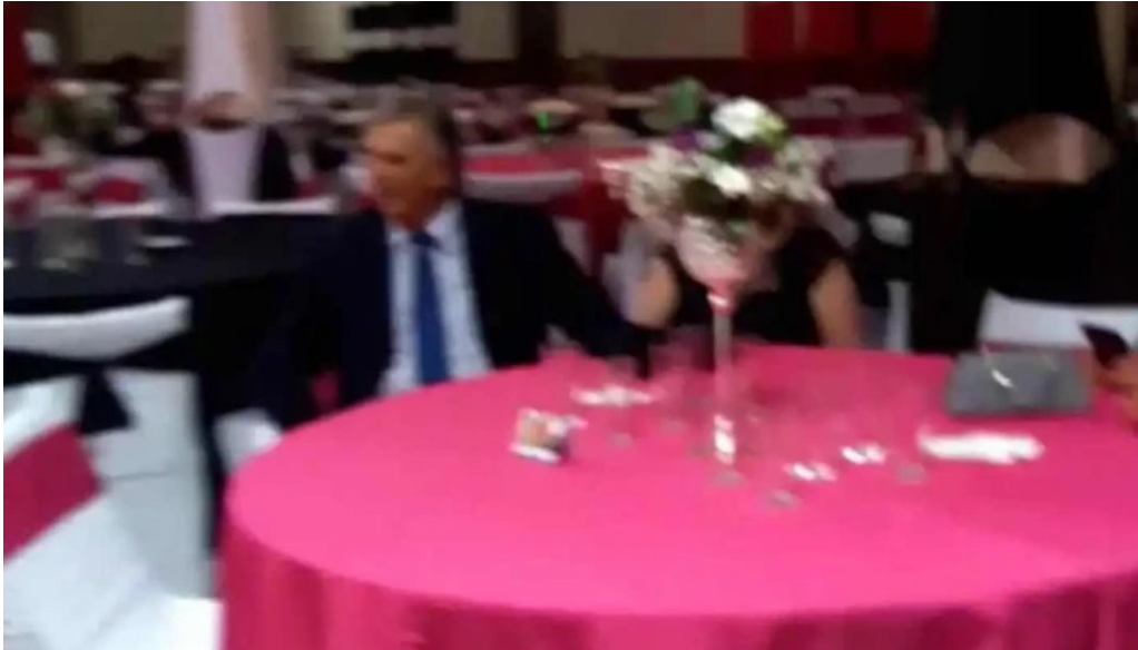
Radiopueblo fm 897 videos