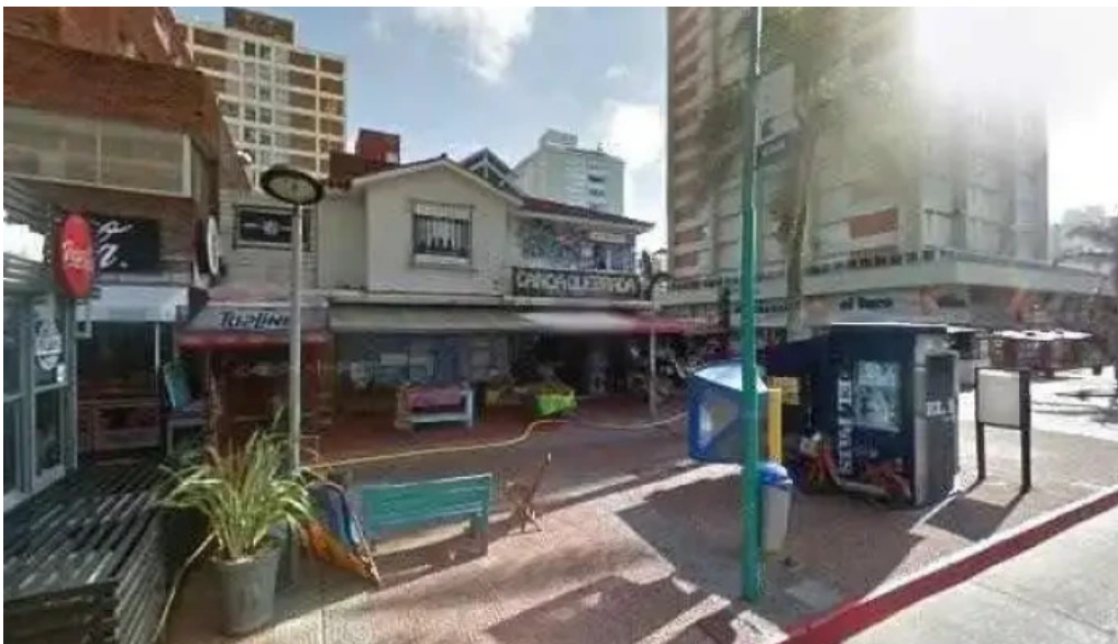
Aspen punta fm 1035 zonadeg