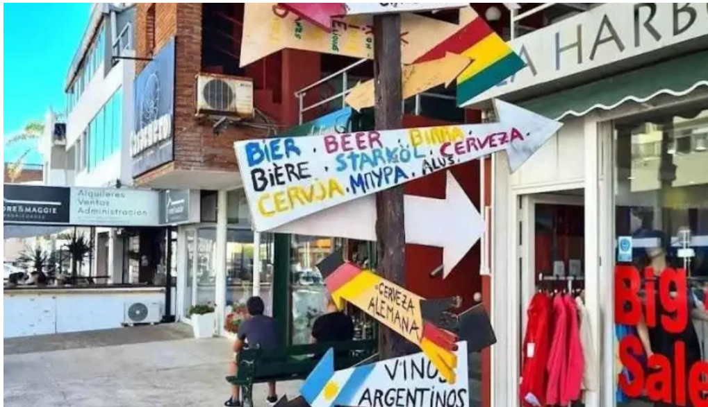
Aspen punta fm 103 5 punta del este