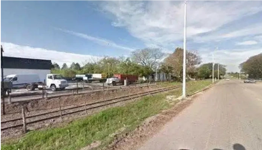
Radio club paysandu abierto ahoradeg