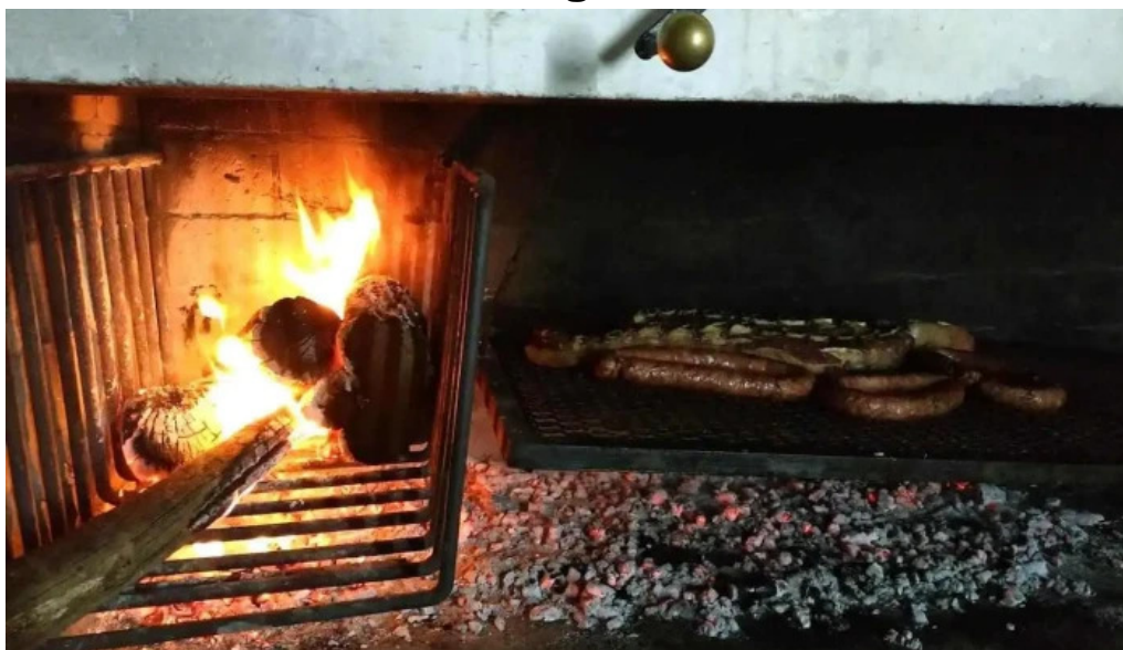
Radio club paysandu paysandu