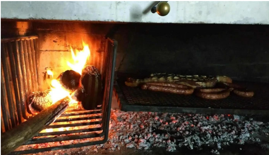
Radio club paysandu abierto ahora