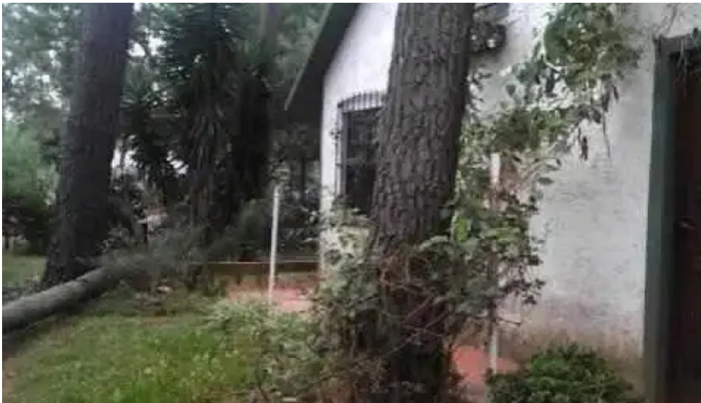
Radio nuestro lugar sitio web