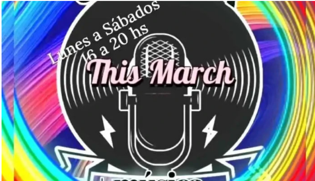
Hebert zapato silva nueva helvecia