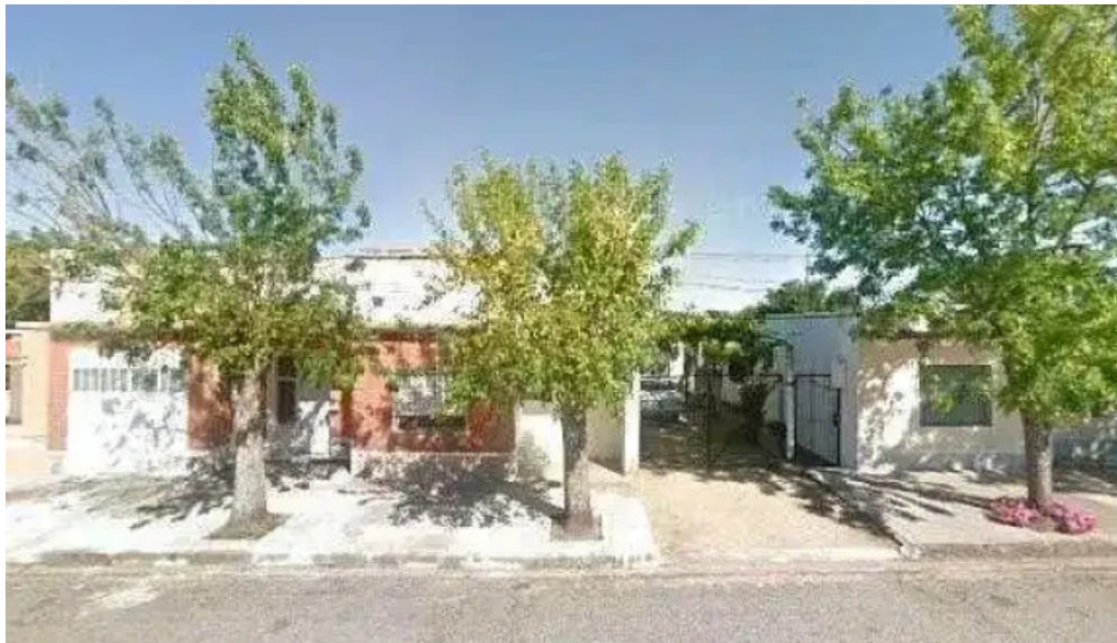
Hebert zapato silva comentariosdeg