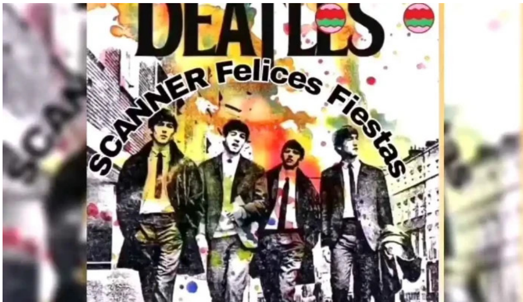
Hebert zapato silva del propietario