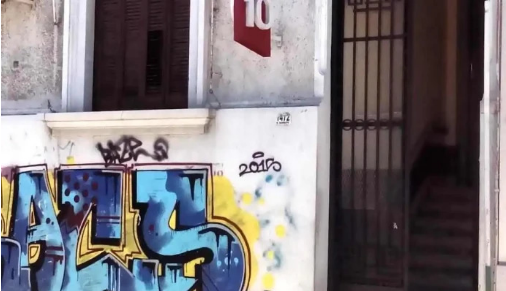
Cx10 radio continente 730 am exterior