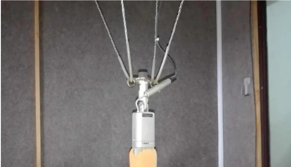
Cx10 radio continente 730 am montevideo