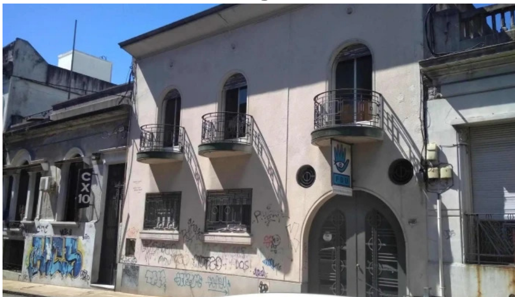
Cx10 radio continente 730 am sitio web