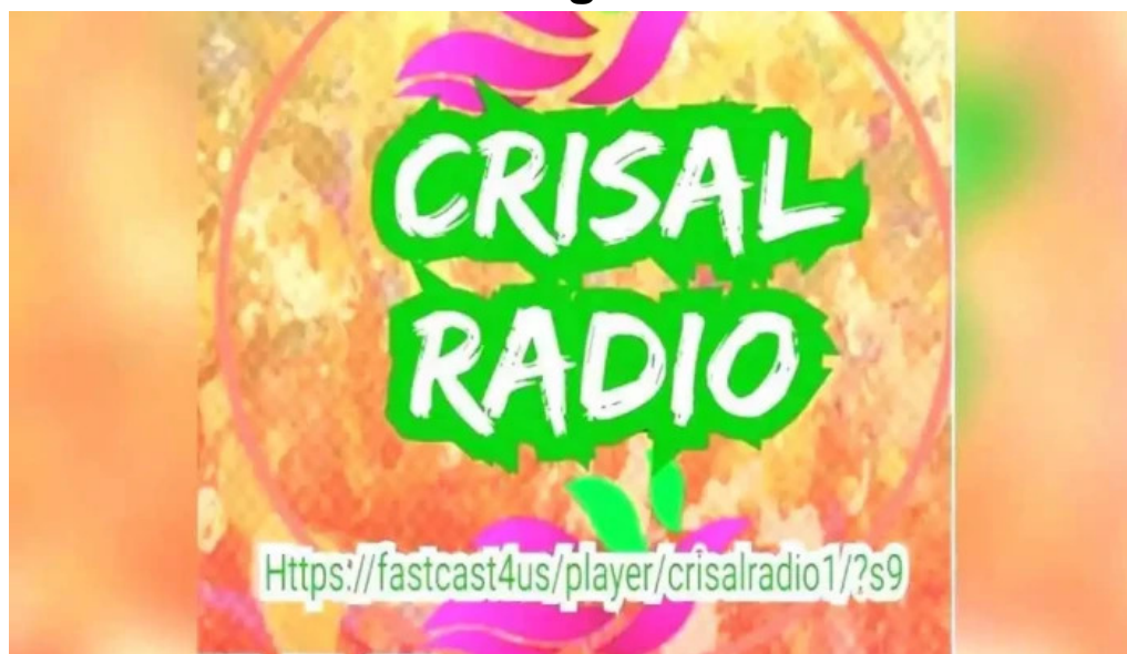
Crisal radio videos