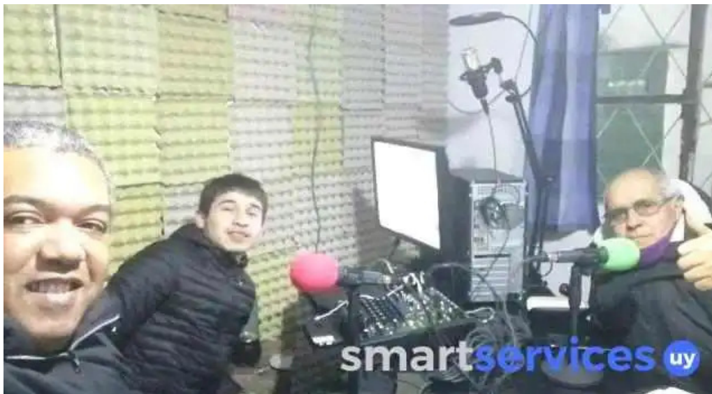
Crisal radio del propietario