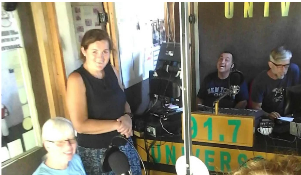
Universo de montes fm cxc 219 cerca de mi