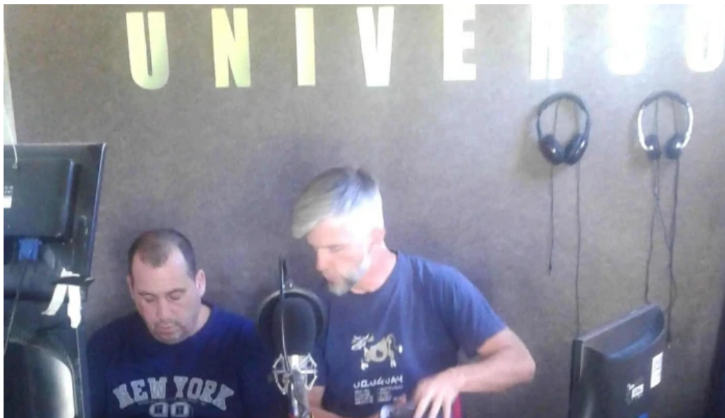
Universo de montes fm cxc 219 montes